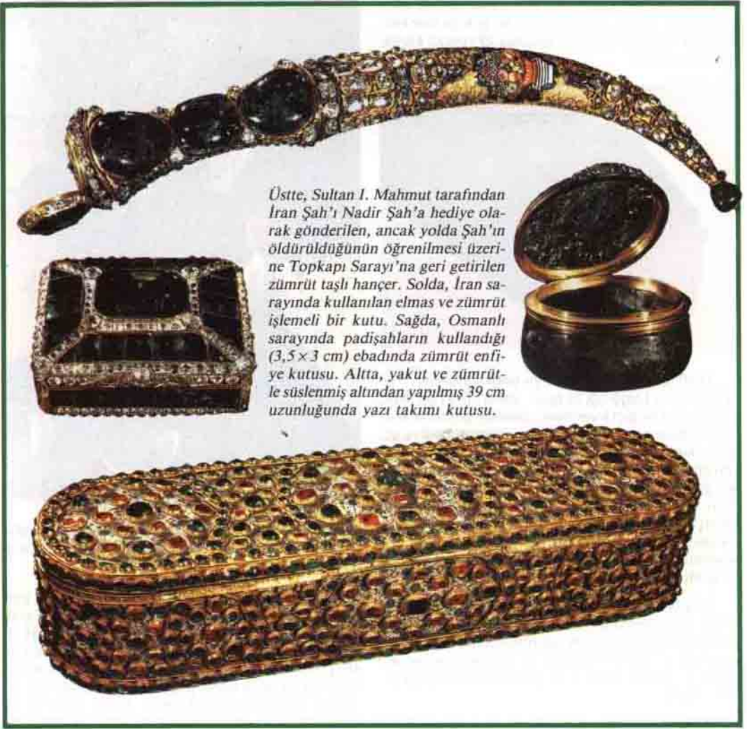
Üstte, Sultan I. Mahmut tarafından İran Şah'ı Nadir Şah'a hediye olarak gönderilen, ancak yolda Şah'ın öldürüldüğünün öğrenilmesi üzerine Topkapı Sarayı'na geri getirilen zümrüt taşlı hançer. Solda, İran sarayında kullanılan elmas ve zümrüt işlemeli bir kutu. Sağda, Osmanlı sarayında padişahların kullandığı (3,5 x 3 cm) ebadında zümrüt enfiye kutusu. Altta, yakut ve zümrütle süslenmiş altından yapılmış 39 cm uzunluğunda yazı takımı kutusu.

ağırlıkları 46,73, 63,83, 66,36 ve 91,32 kirat olan işlenmiş dört zümrüt bulunmaktadır. Bir kemer tokasında yer alan bir zümrüt kristali 52 x 43 mm ebadında olup, 175 kirat gelmektedir. Sarayda bulunan altınla kaplı bir Dünya küresinde, deniz, göl ve okyanus yüzeyleri zümrütten yapılmıştır. Toplam olarak 50 kırıttan ağır birçok zümrütle, 175 kırıtlık iki zümrüt kristalinden oluşmaktadır. Nadir Şah'ın tacında, işlenmiş olarak 225 kirat ağırlığında bir zümrüt bulunmaktadır.