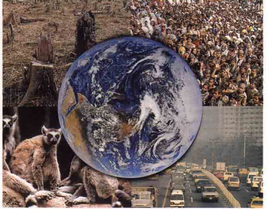
Çevre kirliliği çeşitli şekillerde karşımıza çıkıyor. Gelişmiş ülkelerde, kirlilik büyük şehirlerde yaşanırken, az gelişmiş ülkelerde yaşanan kirliliğin temel nedeni yoksulluk. Bitki örtüsünün ve hayvanların kirlilik yüzünden yok olmaları ise başka kirlilikleri doğuruyor.

keti görünümü kazanmıştır. Kitlesele bilince yerleşen çevre kaygısı, sık sık büyük katılımlı gösterilerin yapılmasıyla artık medyada da boy göstermeye başlamıştır. Bu büyük gösterilerin ilk örneklerinden biri, 1950'lerin sonunda İngiltere'de gerçekleştirilen "nükleer silah karşıtı" gösteridir. Bu gösteriyle birlikte, çevre hareketi, barış hareketi görünümünde ABD'ye, Doğu Avrupa'ya ve Avustralya'ya da sıçramıştır. Daha sonraları çevreciler, nükleer silah