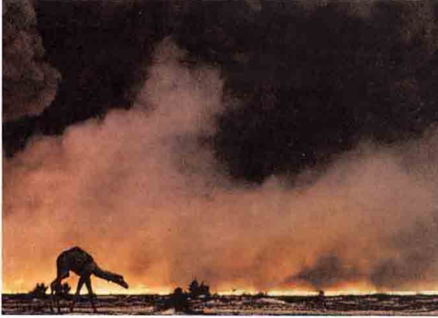
Savaşlar yüzünden tahrip olan çevre başlı başına kirlilik anlamına gelirken, kullanılan silahların yarattığı kirlilik de çok büyük. Körfez Savaşı'ndan sonra çevrede meydana gelen hasar ve kirlilik, savaşın verdiği büyük acılardan biri(şağıda).

lebilirlik Türkiye'de de gündemdeki yerini almıştır. Beş yıllık kalkınma planlarının son üçünde sürdürülebilir kalkınmaya önemli ölçüde yer verilmiştir. Bu yer veriş ne kadar etkili olmuştur tartışılır ama, en azından soruna getirdiği geniş ve farklı bakış açısıyla sürdürülebilirlik konunun ciddiyetini iyi vurgulamış ve çeşitli çevrelerdeki oluşumları hızlandırmıştır.