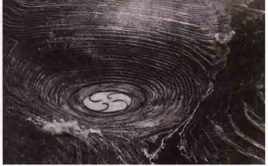
Utah'taki Bingham Bakır Madeni 1973'te Robert Smithson'ın girişimleri ile bu duruma getirilmiş. İnsan eliyle tahrip edilmiş alanların yeniden düzenlenmesi, çevrecilik ile endüstrileşme arasında sanatsal bir köprü kuruyor. Sanatçının amacı buradaki madeni kamuffaj etmek değildir. Aksine merkezde bulunan dört eğri çizgi ile madenin sanatsal bir yansıması sağlanmaya çalışılmıştır. Ne yazık ki, maden işletmecileri Smithson'un değerini anlayamadan, sanatçı 1973 yılında hayata veda etmiştir.

Çevre sorunlarının kamuoyunda devamlı konu edilmesi, sanayiciler ta-