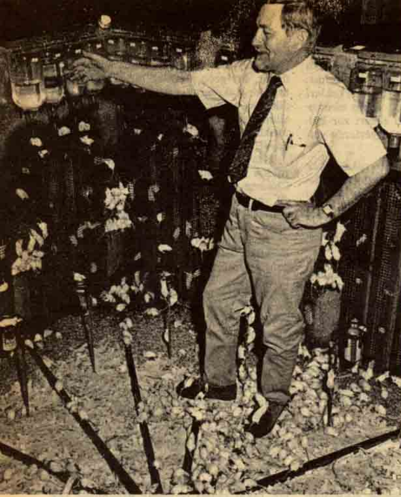
Amerika'lı arařtırıcı Calhoun'un fareler üzerindeki deneyleri kuřaklar arası çatıřmanın tülle- rinin geliřmesindeki rolünü ortaya koymuř oldu.

Homadryas cinsi maymunlar sürü halinde yaşarlar her sürü belli sayıda harem'lerden oluşur; her harem'in başında ise sözü geçen bir erkek vardır. Harem başı erkek maymun sürüde daha saygıdeğer bir duruma yükselmenin özlümini duyan genç erkek maymunlara karşı yerini korumaya çalışır. Patas cinsi maymunlarda bir erkek dört yılda cinsel olgunluğa erişir. Böyle bir erkek sürüde kalmak istiyorsa sürünün başındaki sözü geçen erkeği —ki kendi babası olabilir— kovmak ve onun yerini almak zorundadır. Çok ke-re genç erkek patas sürüyü bırakmak zorunda kalır, ondan sonra ya yalnız olarak veya kendisi gibi sürüden ayrılmış pataslarla birlikte yaşar. Lar cinsi kuyruksuz şebekelerde de genç erkek sürüden ayrılp şansını başka yerlerde aramak zorundadır. Buna karşı Makak cinsi maymunlarda belli bir hoşgörü vardır: sürünün dışındaki genç erkekler sürünün dışileri ile gıftleşebilirler.