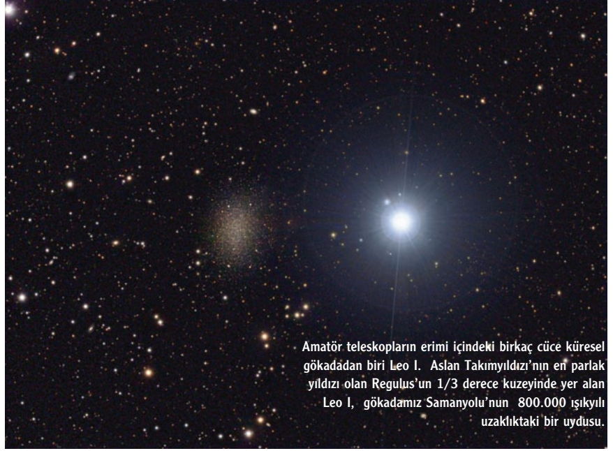
Amatör teleskopların erimi içindeki birkaç cüce küresel gökadanın biri Leo I. Aslan Takımyıldızı'nın en parlak yıldızı olan Regulus'un 1/3 derece kuzeyinde yer alan Leo I, gökadamız Samanyolu'nun 800.000 ışık yılı uzaklıktaki bir uydusudur.

Samanyolu ve komşusu Andromeda gibi büyük gökadalardan çevresinde çok sayıda küçük “küre” biçimli gökada doluyor. Bunlar, yaşlı yıldızlardan oluşmuş seyrek topluluklar. Kuramcılar şimdiye kadar, normalin çok üzerinde karanlık madde içermelerine karşı gazdan yoksun bu küresel cücelerin nasıl oluşabildiklerini açıklayamıyorlardı. Şimdiyse, Zürih Üniversitesi gökbilimcilerinin gerçekleştirdikleri bilgisayar benzetimleri (simulasyon) soruya bir yanıt getirmiş görünüyor. Araştırmacılara göre bunlar da öteki cüce gökadalardan gibi gaz yoğun olarak doğuyorlar. Ama Samanyolu gibi gazca yoğun bir dev gökadanın içinden