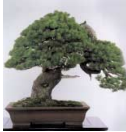
500 yaşlarında 90cm yüksekliğinde bir Japon Akçamı

Aynı prensipler üçüncü şekil için de geçerli. Kırmızı dallar yukarıya doğru uzanıyor. Onları budadık. Mavi dal bir başka güçlü dalın ters yönüne uzanıyor, onu da kestik. Yeşil dalı aşağıya doğru büyütüp boşluğu dolduruyoruz. Bu budamayı ağacın sadece öndeki dalları için değil bütün dalları için yapıyoruz. Tepedeki dalları budadıktan sonra ağaç daha belirgin bir üçgen formu kazandı. Dördüncü şekilde ağacın başlangıçtaki haliyle budama sonrası halini görüyorsunuz. Ağacın bu üçgen formunu korumamız gerekli. Bonsaiyi güzel gösteren önemli unsurlardan biri bu üçgen form.