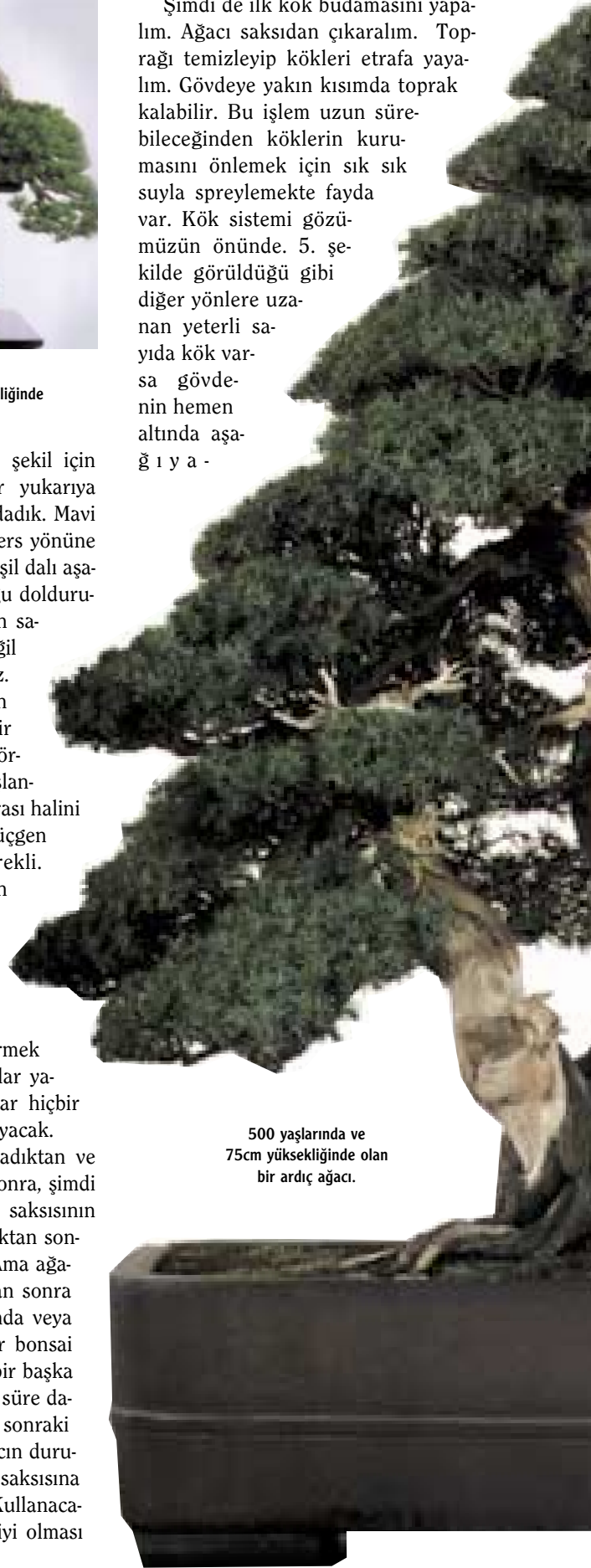
500 yaşlarında ve 75cm yüksekliğinde olan bir ardıç ağacı.

Şimdi de ilk kök budamasını yapalım. Ağacı saksıdan çıkaralım. Toprağı temizleyip kökleri etrafa yayalım. Gövdeye yakın kısımda toprak kalabilir. Bu işlem uzun sürebileceğinden köklerin kurumasını önlemek için sık sık suyla spreylemekte fayda var. Kök sistemi gözümüzün önünde. 5. şekilde görüldüğü gibi diğer yönlere uzanan yeterli sayıda kök varsa gövdenin hemen altında aşağıya -