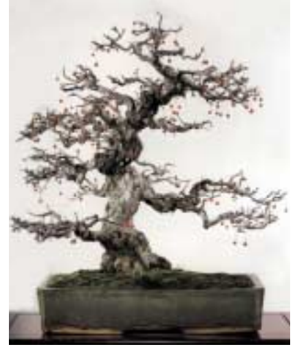
80 yaşlarında 60cm boyunda bir tür Japon süs elması

Kaynaklar: Deborah R. Koreshoff, "Bonsai: Its Art, Science, History and Philo- sophy" Bolarong Publications 1984 "The Essentials of Bonsai" Timber Press 1994 "Sunset Bonsai" Sunset Publishing 1994 www.bonsaiweb.com www.bonsaisite.com