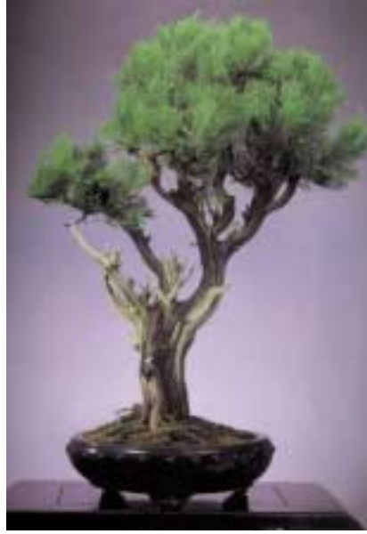
90cm yüksekliğinde bir tür mazi (Thuja orientalis)

Haline Sokma: Kimilerince 'heykeltraşlık tekniği' kimilerince de 'anında bonsai' olarak adlandırılan bu yöntemle fidanlıktan alınan bir ağaç bir kaç saatlik bir uğraş sonunda bir bonsaiye, daha doğrusu eğitime yeni başlamış bir bonsaiye dönüştürülür. Tabii ki bu onu bonsai yapan kişinin sanatsal yeteneklerine bağlıdır. Elde edilen şey istenen bonsai tasarımının iskeletidir. Bonsai sanatçısı zaman geçtikçe bonsaiyi geliştirir ve istediği forma sokar.