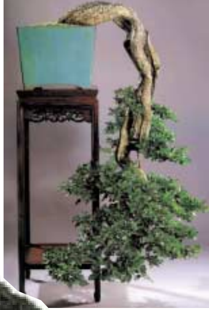
Kengai stilinde bir Premna microphylla

doğru uzanan ana kökü ke- siyoruz. Yaşlı, ölü, aşırı uzamış kökleri de ke- sip kısaltıyoruz. Kök budaması ile birlik- te ağacın üst kıs- mının da budanma- sı, kök ve dal sistemleri arasında b i r