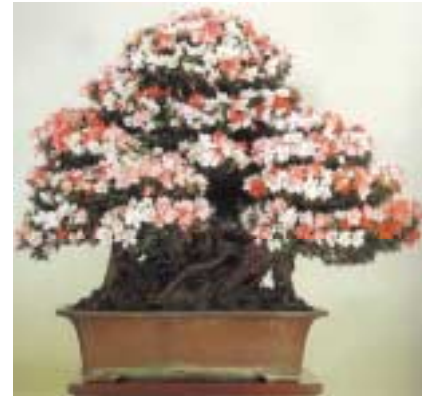
90cm boyunda bir Satsuki açelyası ( Rhododendron indicum )