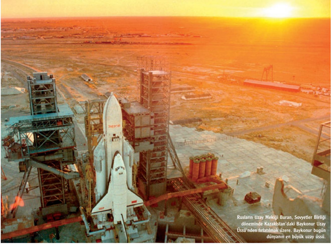
Rusların Uzay Mekiği Buran, Sovyetler Birliği döneminde Kazakistan'daki Baykonur Uzay Üssü'nden fırlatılmak üzere. Baykonur bugün dünyanın en büyük uzay üssü.

milerinde uçuş teknikleri geliştirilirken kimilerinde astronot eğitimleri yapılıyor. Kimileri uzay aracı üretiminde uzmanlaşmışken kimileriye yerden uzaya destek verme konusunda görevler üstlenmiş. Uzay üsleri arasında en ünlülerinden biri Baykonur Uzay Üssü. Kazakistan'ın Baykonur kentinin 320 km güneydoğusunda kurulmuş olan üs, dünyanın en eski ve en büyük üssü olma özelliğini taşıyor. Kentten bu kadar uzak olmasına karşın üssün Baykonur adını taşımasını nedeni Sovyet yönetiminin zamanında bir yanıtma unsuru olarak bu ismi vermiş olması. Kozmodrom olarak da bilinen Baykonur Uzay Üssü'nde bir düzineden fazla fırlatma rampasının yanı sıra beş kontrol kulesi ve dokuz farklı kontrol merkezi bulunuyor. 2 Haziran 1955'te hizmete giren üssün genişliği kuzeyden güneye 80 km, doğudan batıya 130 km. Yapımında askerlerin çalıştığı üssün tamamlanması iki buçuk yıl sürmüştü. Üs yakınlarına, çalışanların ve ailelerinin kalması amacıyla Tyuratam (Sovyet dönemindeki adı Leninsk) kenti kurulmuş. Rus insanlı uzay araçları ve uzay sondaları Baykonur Uzay Üssü'nden fırlatılmış. Uzay tarihinde yer alan birçok önemli uçuşun başlangıç noktası Baykonur olmuş. İnsan yapımı ilk uydu olan Sputnik-1'in, 4 Ekim 1957'de ilk insanlı yö-