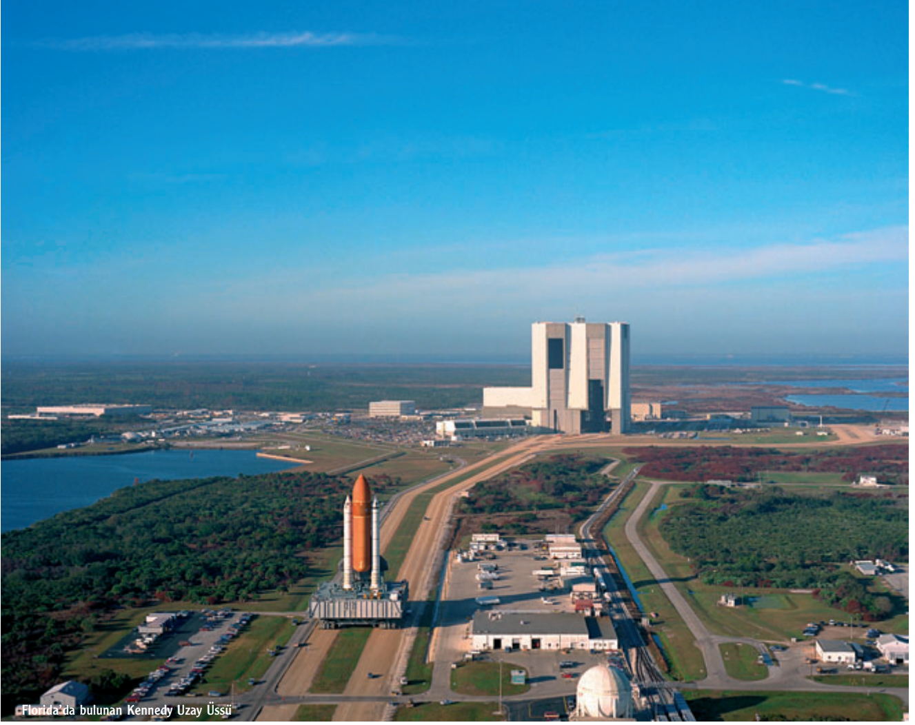
Florida'da bulunan Kennedy Uzay Üssü

İkinci Dünya Savaşı'nın ardından, yirminci yüzyılın ortalarında, dünya birçok yenilikle tanışmaya başladı. İkinci Dünya Savaşı büyük bir savaştı; getirdiği birçok yıkıma karşın savaş sırasında geliştirilen ya da geliştirilmeye başlayan teknolojiler, savaş sonrası insanlığın hizmetine sunuldu ve büyük atılımlar yaşandı. Bu atılımlardan kimileri de roket teknolojisinin gelişmesiyle gelen uzaya açılma projeleriydi. Atmosfer dışına çıkmak, Dünya'nın yörüngesinde dolanmak, Ay'a gitmek gibi projeler bu dönemin öne çıkan gelişmeleri olarak hatırlanıyor. İlk görevler için alışlageldik hava üsleri kullanılıyordu. O dönemin uzay görevleri de daha çok standart uçuş prosedürlerine benziyordu. Başlangıçta hava kuvvetleri üsleri yeterli olurken zamanla yeni üsler kurulması gerekliliği ortaya çıktı. Bu da beraberinde kimi soruları getirdi: Bir uzay üssü nereye kurulur? Bu sorunun yanıtını NASA görevlilerinden James Webb'in anılarından aktarabiliriz. Webb, 1961 yılında bir uzay üssü kurmak üzere görevlendirilen ekip teydi ve en uygun yerin nasıl olması gerektiğini araştırıyordu: "Aradığımız bölge için temel ölçütler, deniz taşımacılığına ve her türlü hava koşulunda çalışabilecek bir hava üssü kurmaya