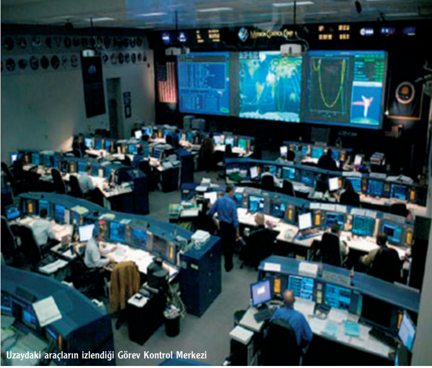
Uzaydaki araçların izlendiği Görev Kontrol Merkezi

kıyısında olmalıydı.” Bu ölçütler sonucunda bugün Lyndon Johnson Uzay Üssü olarak bilinen merkezin kurulduğu Houston kenti seçildi. Bu ölçütlerin 1960’ların ABD’sinde belirlendiğini yine de aklımızdan çıkarmayalım. Günümüzde farklı ülkelerin farklı koşullar gözeterek hizmet verdiği merkezler bu ölçütlerle uyuşmuyor olabilir Bu da gösteriyor ki, bir uzay üssü ne olursa olsun gereksinime uygun biçimde tasarlanmalı. Farklı bölgelerin farklı gereksinimleri olduğu gibi, yöresel özellikler kimi zaman avantaj ya da dezavantaj olarak da ortaya çıkabilir. Elbette kimi temel ölçütler göz ardı edilemez. Sözgelimi uzay üslerinin ekvatora yakın bölgelerde kurulması uzay araçlarının fırlatılmasında daha büyük avantajlara neden oluyor. Ekvatordan fırlatılan araçlar daha az enerji harcı-