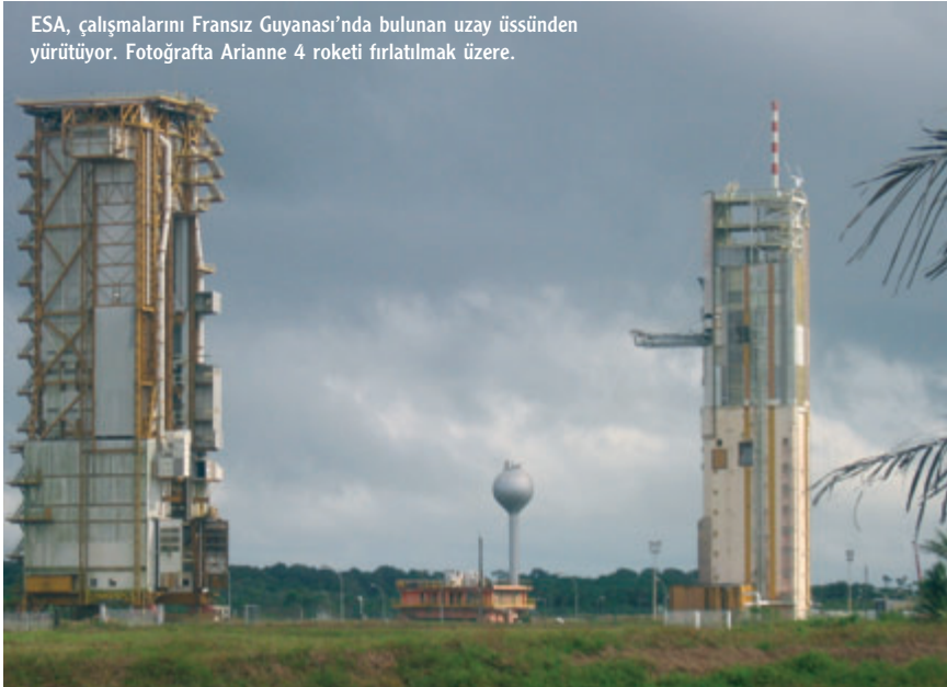
ESA, çalışmalarını Fransız Guyanası'nda bulunan uzay üssünden yürütüyor. Fotoğrafta Ariane 4 roketi fırlatılmak üzere.

Uzay mekiklerinin evi olarak bilinen Kennedy Uzay Üssü de en tanın-