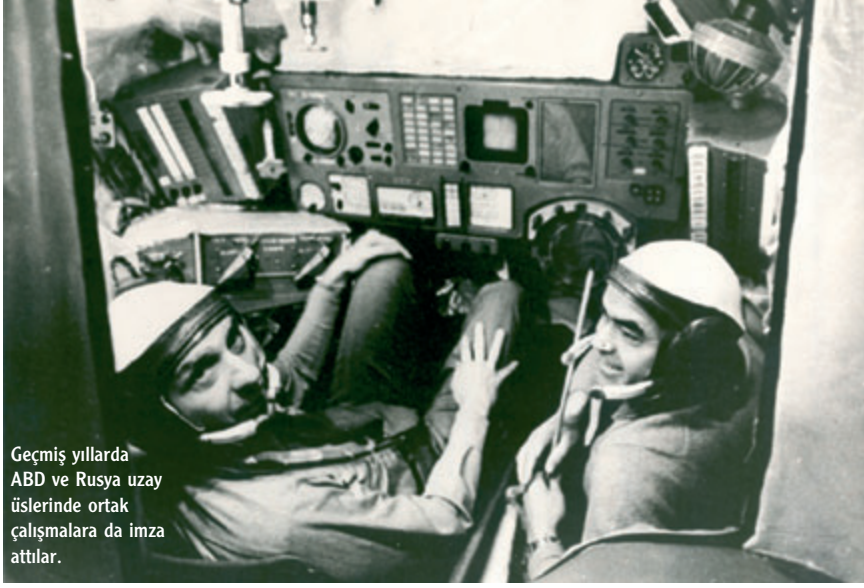
Geçmiş yıllarda ABD ve Rusya uzay üslerinde ortak çalışmalara da imza attılar.

tülmeye devam ediyor. Yetkililer Baykonur Uzay Üssü'nün yapımından bugüne değin, yaklaşık 1100 fırlatma yapıldığını söylüyorlar. 1980-1990 yılları arasında MIR uzay programını destekleyen üs, Columbia felaketinden sonra ABD'nin uzay mekiği programına ara vermesiyle, Uluslararası Uzay İstasyonu'na destek veren tek üs haline gelmişti. Başlangıçta Rusların balistik füzelerine ev sahipliği yapan üste bugün Soyuz uzay araçları bulunuyor. Baykonur Uzay Üssü Rusya'ya kiralanırken yapılan antlaşmada yer alan maddelerden biri, Kazakistan'ın üstün dilettiği gibi yararlanabilmesiydi. Kazakistan ve Rusya geçtiğimiz yıllarda Baykonur içinde Bayterek adı verilen yeni bir uzay kompleksi kurdular. Kazakistan'ın desteğiyle gelişen bu projenin amacı, uzay araçlarının çevreye zarar vermeden uzaya gönderilmesi. Baykonur, bugün çalışmalarını sürdüren uzay üsleri arasında en büyük olanı. Rusya, Arganjelsk'te bulunan Ple-