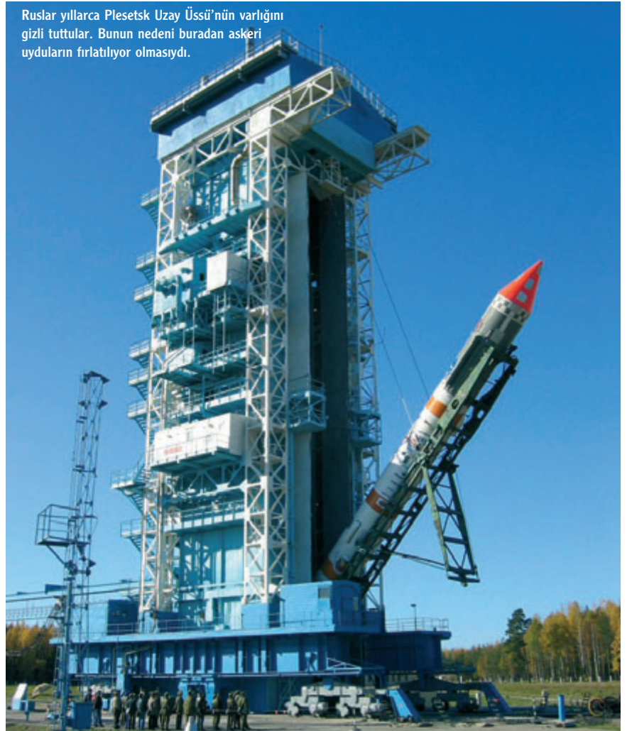
Ruslar yıllarca Plesetsk Uzay Üssü'nün varlığını gizli tuttular. Bunun nedeni buradan askeri uyduların fırlatılıyor olmasıydı.

nur üssü, Kazakistan Cumhuriyeti sınırlarında kaldı. Bununla birlikte Rusya Federasyonu yıllık 115 milyon dolar kira bedeli ödeyerek üssü 2050 yılına kadar kiralandı. Rusya Federasyonu'nun uzay görevleri bu üstün yürü-