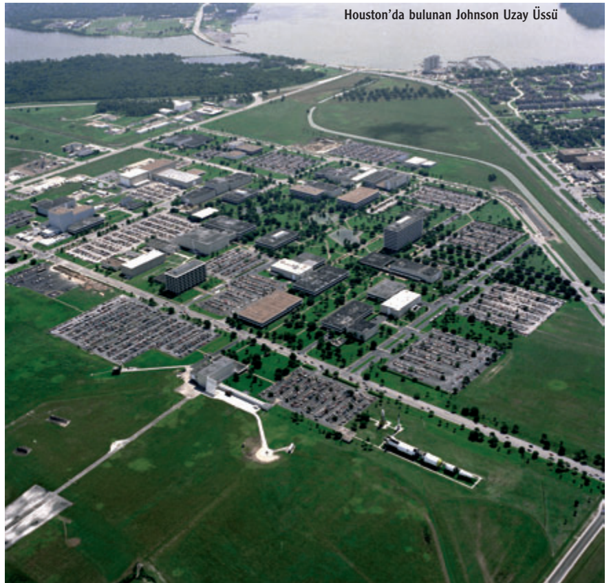
Houston'da bulunan Johnson Uzay Üssü

bir ölçüttü. Öncelikle bir kent olmalıydı; çünkü gereksinim duyacağımız teknoloji enstitülerini destekleyecek olanaklar bir kentte bulunabiliyordu. Bir havaalanı olmalıydı; böylece uçuş testlerimizi gerçekleştirebilir, uzay araçlarımızı indirebileceğimiz bir alana sahip olabilirdik. O dönemlerde uzay araçlarımızı deniz yoluyla, teknelerle taşımayı planlıyorduk; bu nedenle üs deniz