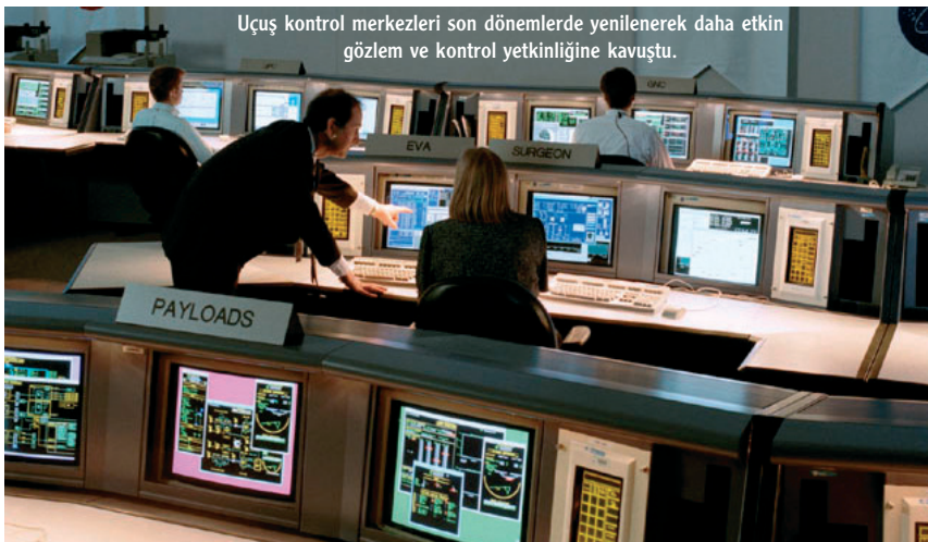
Uçuş kontrol merkezleri son dönemlerde yenilenerek daha etkin gözlem ve kontrol yetkinliğine kavuştu.

Kaynaklar: http://www.turkatak.gen.tr/index.php?option=content&task=view&id=73 http://www.jsc.nasa.gov/history/jsc40/jsc40_pg8.htm http://en.wikipedia.org/wiki/Spaceport