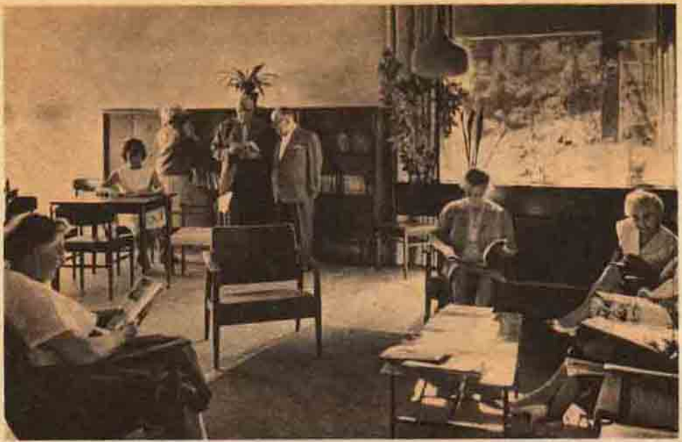
Bir huzur yuvası salon ve kitaplığı.

hareket ederek yerleşme sahalarını tesbit etme zorundadırlar. Huzur yuvalarının inşasında dikkat edilecek başlıca özellikleri şöylece derlemek mümkündür: