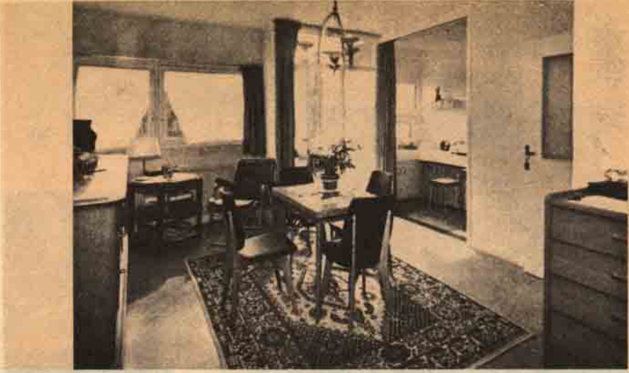
Bir stüdyonun genel görünüşü.

konutu bu hali ile ele almamakta oldukları ve daha dar çerçeveler içerisinde kaldıkları görülmektedir. Bunu bir imkânsızlıktan çok bir alışkanlık ve kolaylık olarak kabul etmek uygun olur. Biz burada bu dar çerçeveden çıkarak sağlıklı yaşlı insan konutları probleminin Batıda ve özellikle Fransadaki uygulamasını ortaya koymak ve yapılan ve yapılacak olan çalışmalara yardımcı olmak istiyoruz.