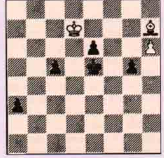
Beyaz oynar kazanır

Çözümler (I) Siyah Şah pek çok açıdan saldırı altındadır. 1. Kh4+! Şxh4 (eğer 1...gxh4 2. Vg6 mat) 2. Vh7+ Vh5 3. Kxg3+ Şg4 4. Vd7+ Kf5 5. Vd1+ f1-1-0 (II) a piyonunu 1. Fb1 ile durdurmaya çalışmak bir işe yaramaz 1...Şf6 2. Şe8 g4 3. Şf8 a2. Beyaz Ff1'i daha yararlı kullanır. 1. Fe4! Şf6 (ya da 1...a2 2. h7 a1v 3. h8v+ 2. Şe8! a2 3. Şf8 a1v 4. h7 ve Siyah ya mat olur ya da a1'deki vezir kaybeder.