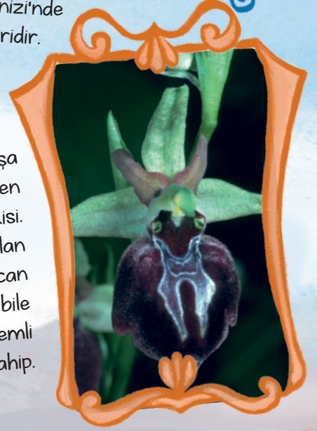
Azerbaycan'ın řuřa kentinde yetiřen hr-ı blbl bitkisi. Bir tr orkide olan hr-ı blbl, Azerbaycan kltrnde řarkılara bile konu olacak kadar nemli bir yere sahip.