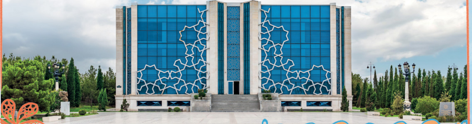
Gence kentinde bulunan Nizamî Gencevî Müzesi

Azerbaycan denince akla elbette edebiyat ve müzik de gelir. Nizamî Gencevî, Fuzulî, Nesimî, Molla Penah Vâgîf ve Hurşidbanu Natevan gibi sanatçılar Azerbaycan edebiyatının önemli isimleri arasındadır.