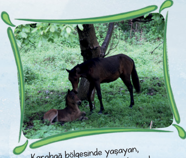
Karabađ blgesinde yařayan, hızlı kořmasıyla nl Karabađ atı.

Azerbaycan hem dođal gzellikleri hem de bitki ve hayvan eřitliliđiyle dikkat eken bir lke.