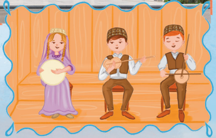
Muğam seslendiren sanatçılar

Geleneksel Azerbaycan müziğini oluşturan öğelere muğam denir. Ses sanatçıları, ünlü şairlerin şiirlerini herhangi bir muğamı kullanarak seslendirir. Bunun adı "muğamat"tır. Azerbaycan muğamları, 2003 yılında UNESCO tarafından Somut Olmayan Kültürel Miras Listesi'ne alınmıştır.