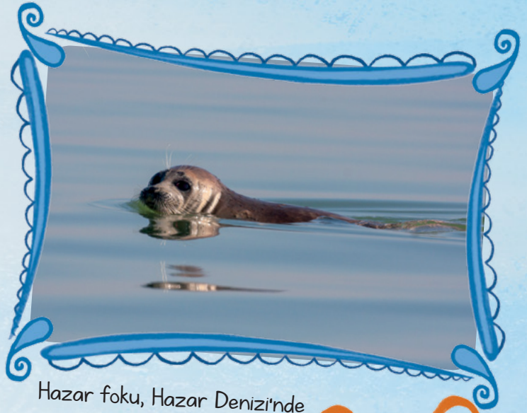
Hazar foku, Hazar Denizi'nde yařayan canlılardan biridir.

Azerbaycan'ın korunan trleri ve zengin dođası, lkenin eřitli blgelerinde yer alan mill parklarda grlebilir. Hirkan, Gygl, řirvan, Abřeron ve řahdađ gibi mill parklar bu alanlar arasında sayılabilir.