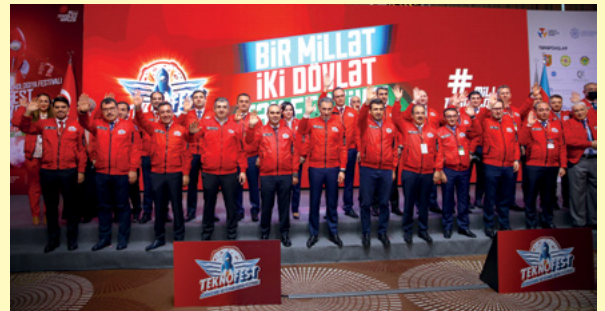
TEKNOFEST Azerbaycan'ın tanıtım toplantısı 7 Şubat 2022'de, Bakü'de gerçekleştirildi.