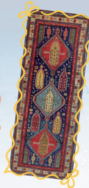
Qazax 20. yüzyıl

Dokumalardan bahsetmişken Azerbaycan'ın önemli bir değeri olan halıcılığa değinmemek olmaz. Ülkenin farklı kentlerinde dokunan pamuk, ipek ve yün halılar; bölge, kompozisyon, dokuma biçimi, desen ve renk özellikleri bakımından türlere ayrılıyor.