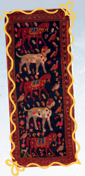
Şuşa 20. yüzyıl