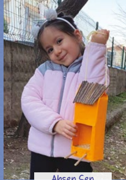
Ahsen řen 5 yař - Aksaray