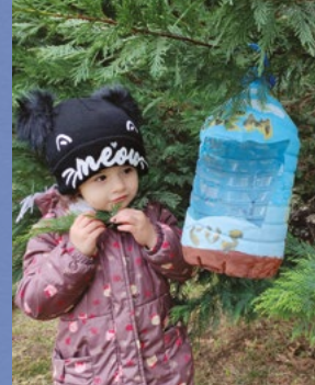
Eslem Serra Altun - 3 yař - Samsun