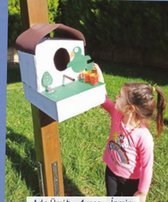
Ada Ümit - 4 yaş - İzmir