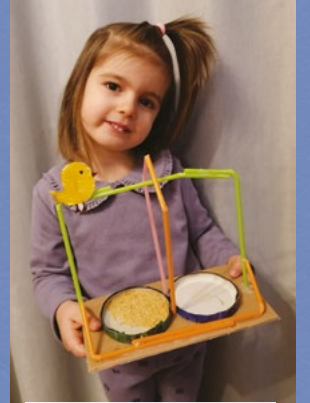
Nehir Kıvrak - 3,5 yaş - Sinop