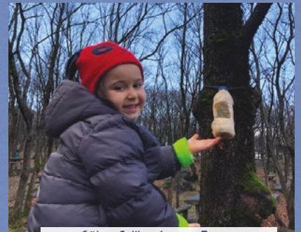
Gke elik - 4 yař - Bursa