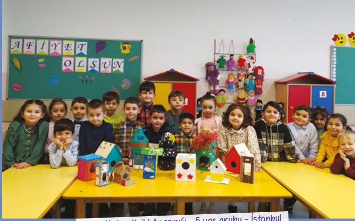
Hüma Hatun Kahl Anasınıfı - 5 yaş grubu - İstanbul