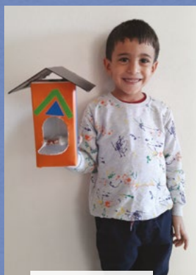
Deniz Akgün 5 yaş - Adıyaman