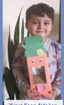
Yunus Kaan Aldođan 3 yař - Kayseri