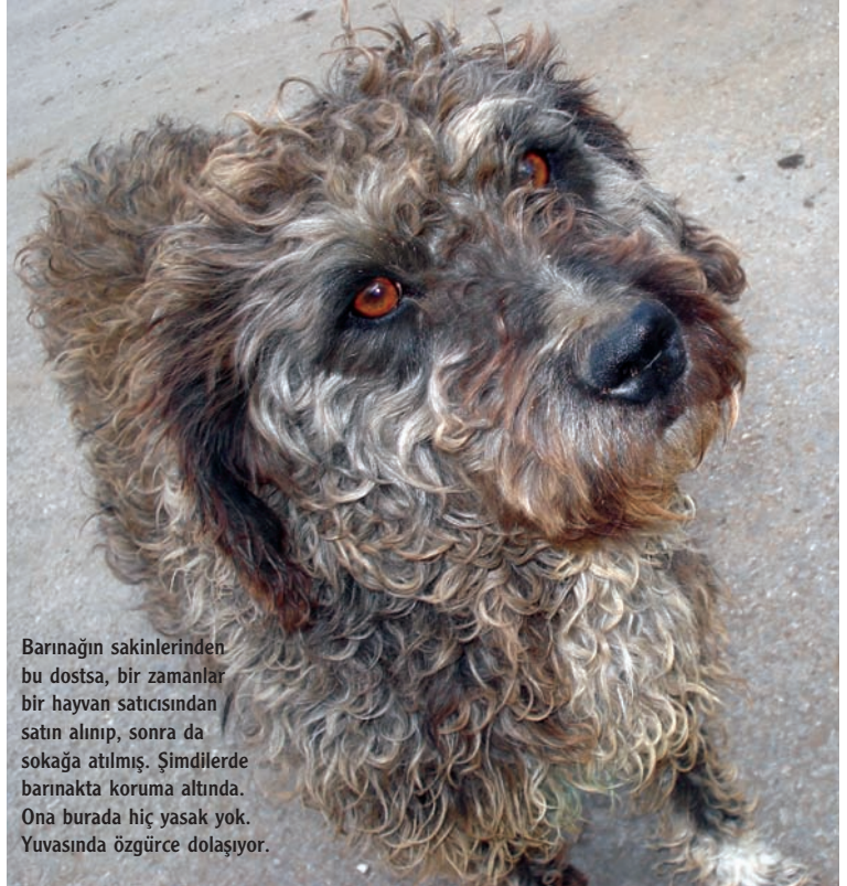
Barınağın sakinlerinden bu dostsa, bir zamanlar bir hayvan satıcısından satın alınıp, sonra da sokağa atılmış. Şimdilerde barınakta koruma altında. Ona burada hiç yasak yok. Yuvasında özgürce dolaşiyor.