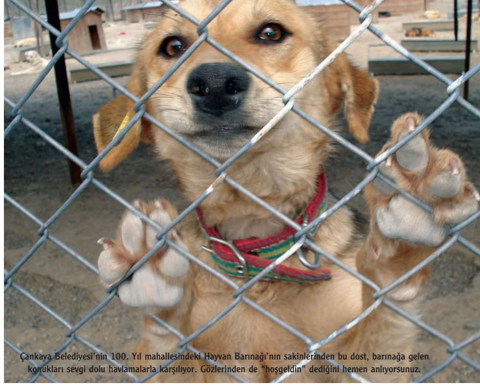
Çankaya Belediyesi'nin 100. Yıl mahallesindeki Hayvan Barınağı'nın sakinlerinden bu dost, barınağa gelen konukları sevgi dolu havlamalarla karşıyor. Gözlerinden de “hoşgeldin” dediğini hemen anlıyorsunuz.