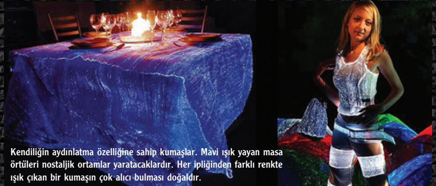
Kendiliğinden aydınlatma özelliğine sahip kumaşlar. Mavi ışık yayan masa örtüleri nostaljik ortamlar yaratacaklardır. Her ipliğinden farklı renkte ışık çıkan bir kumaşın çok alıcı bulması doğaldır.

Esnek ve yıkanabilen nanosensörlerin ve aygıtların kumaş içerisine aktarılmasıyla, kullandığımız elbiselerimiz yeni boyutlar kazanacak; elbise artık görececek, duyacak, hissedecek, komut verecek, ve enerji üretecek hale gelecek. Burada vurgulanması gereken önemli bir nokta şudur ki: Nanoaygıtların boyutları o kadar küçük olacak ki, elbiseyi giyene herhangi bir zorluk ge-