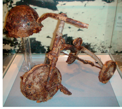
Atom bombası birçok hayatı etkiledi. Hiroşima Atom Bombası müzesinde sergilenen bu çocuk bisikleti baba tarafından muhafaza edilmiş.

Kırmızı daire bombanın düştüğü alanı, siyah nokta Hiroşima Atom Bombası Müzesi'nin yerini gösteriyor. Bomba sonrası ayakta kalan ve Hiroşima'nın simgelerinden biri haline gelen Hiroşima Sanayi Sarayı Binası köprü'nün sol tarafında görülüyor. T şeklindeki Aioi Köprüsü hedef olarak kullanıldı.