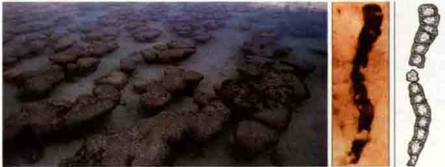
Avustralya'nın Shark Bay bölgesinde yer alan, siyanobakterilerin oluşturduğu yapılar ve yine Avustralyada bulunan ve yaklaşık 3.5 milyar yıl öncesine tarihlenen siyanobakteri fosili. Siyanobakteriler, fotosentez sonucunda saldıkları serbest oksijen ile, anaerobik prokaryotlardan aerobik ökaryotlara geçiş sürecinde temel dış etmen olarak önemli rol oynamışlardır.