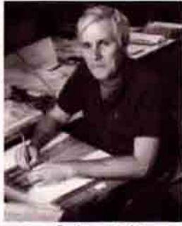
Linnaeus organizmaları dış görünüşlerine göre sınıflandırmış. Carl Woese ise bilim tarihindeki yerini gen analizine dayalı soy ağacının mimarı olarak almıştır.

sınıflandırma ise, evrimsel ortaya çıkışın izini sürer. Bunun için karakterlerin ikelliğini, ileriliğini ya da hangisinin hangisinden türediğini araştırır. Bu evrimsel süreci araştırmada son yıllarda kullanılan bir yöntem ise ribozomal RNA ile ilgilidir.