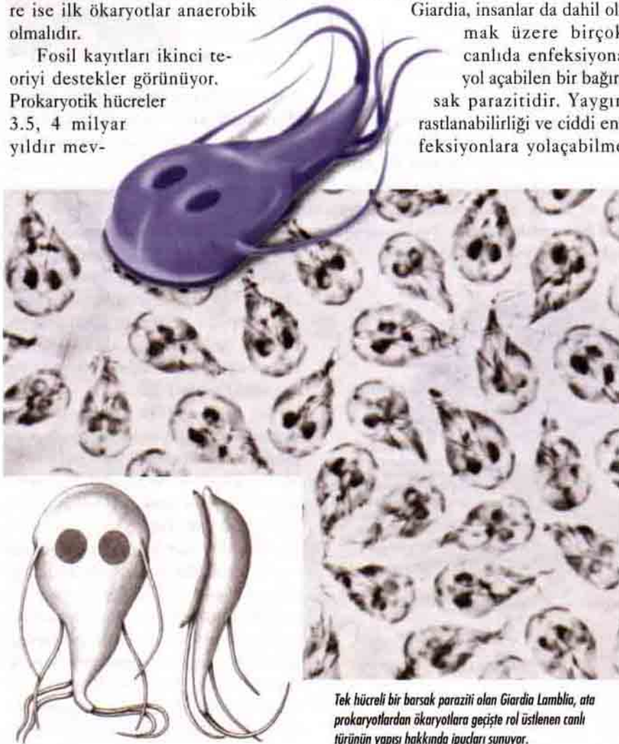
Tek hücreli bir barsak paraziti olan Giardia Lamblia , ata prokaryotlardan ökaryotlara geçişte rol üstlenen canlı türünün yapısı hakkında ipuçları sunuyor.