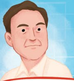
Elon Reeve Musk

Doğum Yılı: 1971 Doğum Yeri: Pretoria Kurucu: SpaceX Boy: 1,88 metre Kütle: 94,6 kilogram