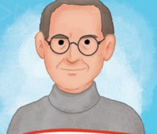
Steven Paul Jobs

Doğum Yılı: 1955 Doğum Yeri: Kaliforniya Kurucu: Apple Bilgisayar Boy: 1,88 metre Kütle: 80,8 kilogram