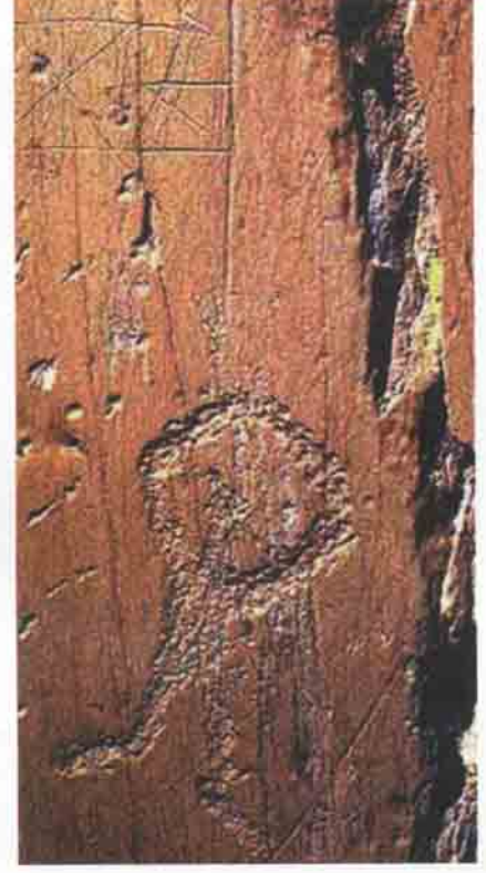
Fontanalba vadisinde sıklıkla rastlanan hançer ve boynuz şekilli formlardan birkaçı.

eski Bronz'un tüm dönemlerinde çok yaygın olan hançerlere benzer. Kalkolitik dönemdeki Remedello uygarlığının karakteristik hançerinin kaya resimlerinde temsil edilmeyişi, Mont Bego bölgesindeki silahların Kalkolitik'ten sonra olduğunun düşünülmesine yol açıyor.