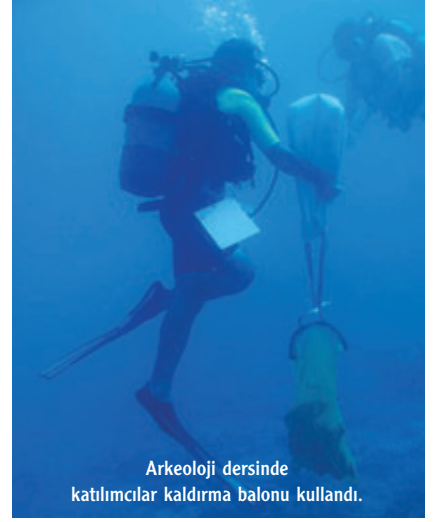
Arkeoloji dersinde katılımcılar kaldırma balonu kullandı.