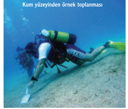
Kum yüzeyinden örnek toplanması