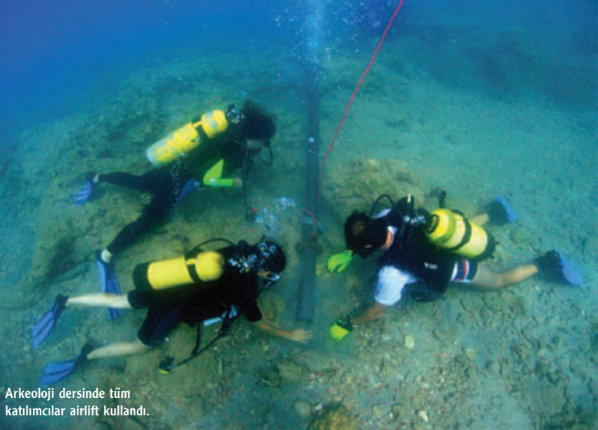
Arkeoloji dersinde tüm katılımcılar airlift kullandı.

Bilimsel dalış eğitiminin üçüncü gününde, ODTÜ Deniz Bilimleri Enstitüsü'nden Doç. Dr. Ali Cemal Gücü tarafından doğrudan gözleme dayalı balık sayım yöntemiyle, balık araştırma tekniği ve uygulaması, Posidonia deniz çayırları araştırmaları yaptırıldı. Diğer uygulama derslerinde olduğu gibi ilk olarak teorik bilgiler verildi. Uygulama dalışları, Posidonia deniz çayırlarının Akdeniz'deki en doğu sınırı olan Turgutlar Koyu'nda yapıldı. Posidonia deniz çayırlarının alt sınırının belirlenmesi (o bölgede yaşadığı en derin yer), yoğunluğu ve çayır boylarının ölçümü gibi uygulamalar yapıldı. Ancak bu bölgede denizdeki bulanıklıktan dolayı görüş çok düşüktü. Bu durum uygulama dalışı için uygun olmadığından yal-