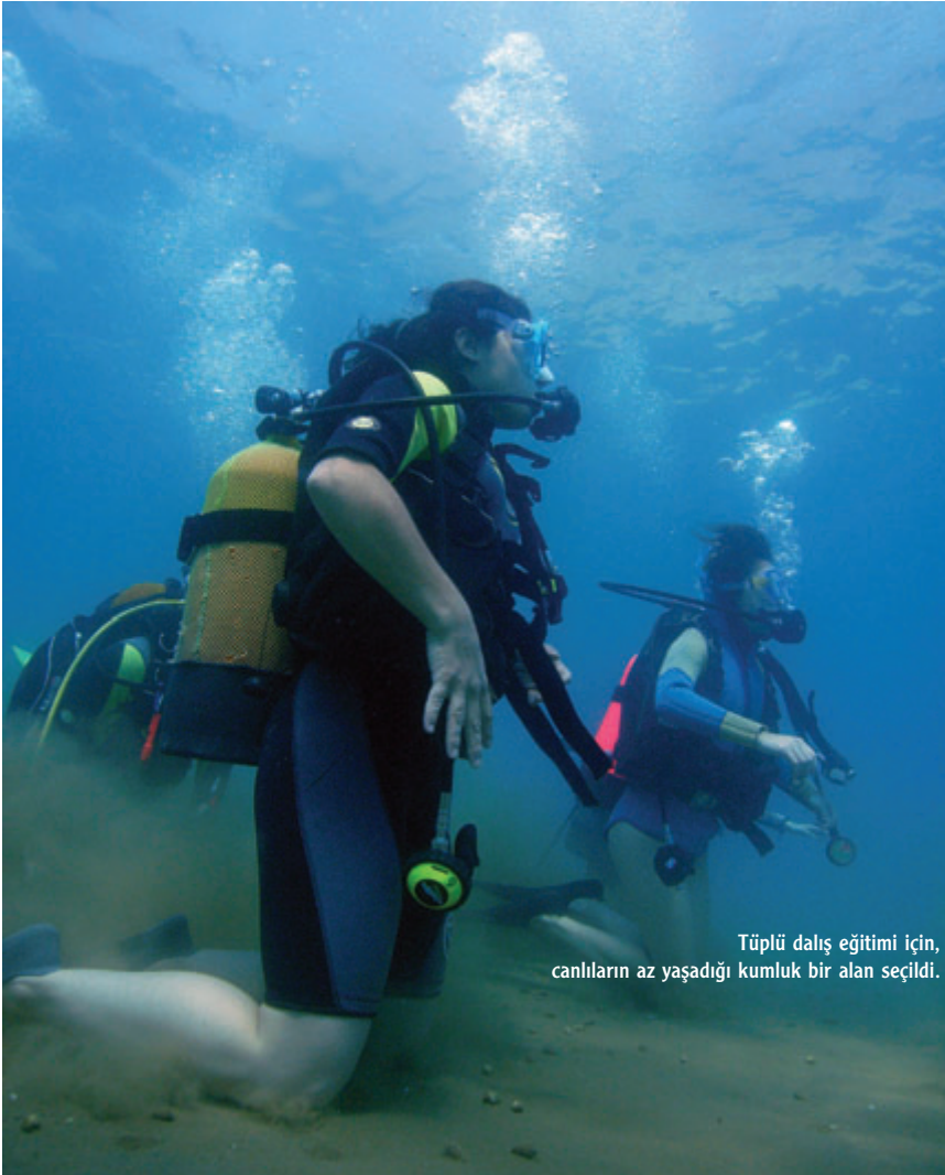
Tüplü dalış eğitimi için, canlıların az yaşadığı kumluk bir alan seçildi.

ni belirtti. Yokeş, ilk olarak kendi araştırmalarında kullandığı araç - gereçleri tanıttı. Bu derste gördük ki, sualtı bilimsel araştırma için çok pahalı araçlara gerek yok. Hırdavat malzemeleriyle de benzer araştırmalar yapılabilir. Örneğin, ayakkabı fırçası, plastik boru, alüminyum folyo, plastik kutu, çekiç gibi malzemeler sualtından örnek toplamak için kullanılabilir. Yokeş, tüm katılımcılara sualtında, farklı yaşam alanlarından (kumluk, kayalık yerler gibi) örnek toplama çalışması yaptırdı. Katılımcılar, ilk olarak daldıkları bölgenin ekosistemini inceledikten sonra kum yüzeyinden, kaya yüzeyinden fırça ve kürekle örnek topladılar. Dalışlar bittikten sonra katılımcılar topladıkları örnekleri incelediler.