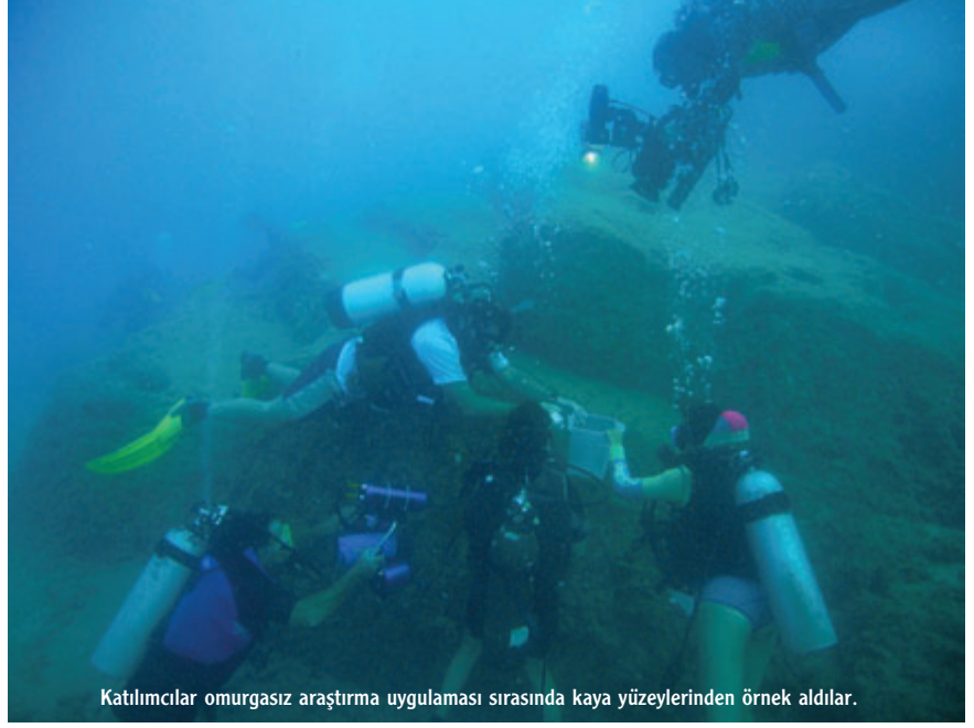
Katılımcılar omurgasız araştırma uygulaması sırasında kaya yüzeylerinden örnek aldılar.

yüzlerine taktıkları maskelerin içine su doldurmaları istendi. İçi suyla dolu maskeyle konuşmaları da istenen katılımcılar burundan nefes almayı kontrol etmeye çalıştılar. Daha sonra sualtında maskenin içine su girerse, yüze çıkmadan nasıl boşaltılacağı öğretildi. Bunun bir ileri aşaması olan maskeyi suya atma, dalıp maskeyi bulma ve sualtında boşaltıp yüze çıkma çalışması da yaptırıldı. İlk gün, tüplü dalış malzemelerinin dalıştan önce nasıl bağlanacağı öğretilerek bitirildi. Kampın ikinci gününde tüplü dalış eğitimi verildi. Dalışlar Türkiye Sualtı Sporları Federasyonu'nun (TSSF) önermiş olduğu eğitim sistemine uygun olarak verildi. İlk üç gün boyunca bilimsel dalgıç adayı olacak olan katılımcılara sualtında tüpten gelen havayı soluma, maskeden su boşaltma, maskesiz nefes alıp verme, sualtında dengede kalma, dalış eşiyile hava paylaşımı gibi temel dalış becerileri katılımcılara kazandırıldı. Dalış eğitiminin sonunda katılımcılar 18 metre derinliğe kadar indiler ve dalış eğitimini tamamladılar. Toplam 6 dalış sonunda tüm becerileri kazanan dalgıçlar, sualtında kendi kendilerine yetecek duruma geldiler.