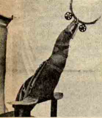
... Penslerini taşımaya alışarak... 250 m. ye kadar denize dalıyor.