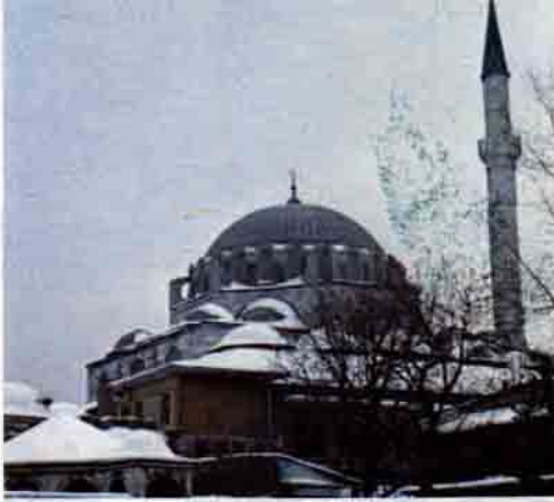
Rüstem Paşa Camii

şah, "Bu bina eylediğin Allah evini sıdk-ı safa ve duâ ile sen aç!" diyerek anahtarı Mimar Sinan'a vermiştir.