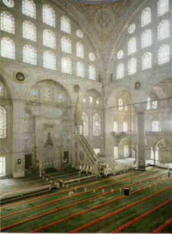
Edirnekapi Mihrimah Sultan Camii'nin iç görünüşü.

topluluğudur. Mimar Sinan'ın 1539 yılında inşa ettiği Şeyh Yahya Efendi Medresesi (Beşiktaşlı Şeyh Yahya Efendi, Kanunî Sultan Süleyman'ın süt kardeşidir), günümüze kadar gelememiştir. Yahya Efendi Medresesi, Sinan'ın günümüze ulaşmayan tek eseri değildir. Meselâ 1540'larda Vezir-i Âzam Lütü Paşa adına inşa ettiği Yenibağçe'deki hamamdan da bugün hiçbir iz yoktur.