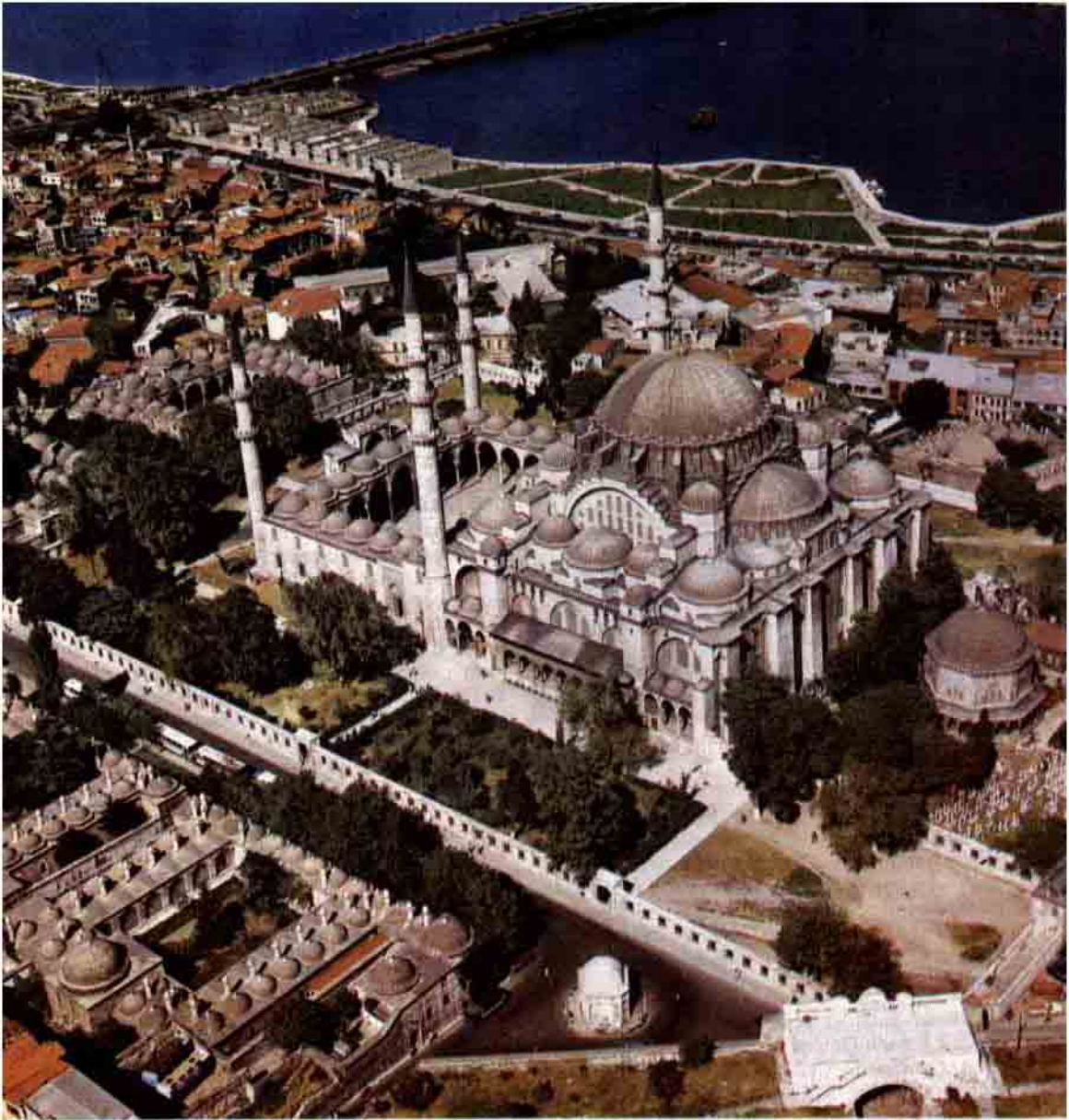
Mimar Sinan'ın "kalfalık devri eserim" dediği Süleymaniye Camii ve Külliyesi (S.Güner)

Bakanı" durumundadır. Hassa Mimarlar Ocağı ise, geniş Osmanlı topraklarının imarıyla görevlendirilmiştir. Ülkedeki bütün resmî yapı faaliyetleri, bu kuruluşun denetimi altındadır. Mimarlar dışında yapı işleriyle ilgili sanatkarları da bünyesinde barındıran Ocak, aynı zamanda bir öğretim kurumu gibi çalışmaktadır. Mimarlar, ustalar burada eğitilmekte, pratik olarak yetiştirilmektedir.