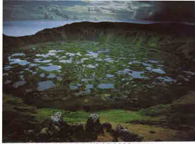
Easter adasında küçük otlardan başka hiçbir bitki kalmamıştı

kadar muhteşemdi ki bunları uzaylıların yaptığını iddia edenler bile var.