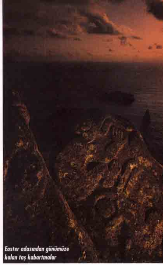
Easter adasından günümüze kalan taş kabartmalar

18. ve 19. yüzyıllarda burayı ziyaret eden Avrupalılar ada nüfusunun 2 000 kadar olduğunu tahmin ediyorlardı. Burada yaşayan insanların denizcilikte çok ilerlemiş olmaları gerekiyordu, ancak yaptıkları kanolar oldukça ilkel. Bu ne-