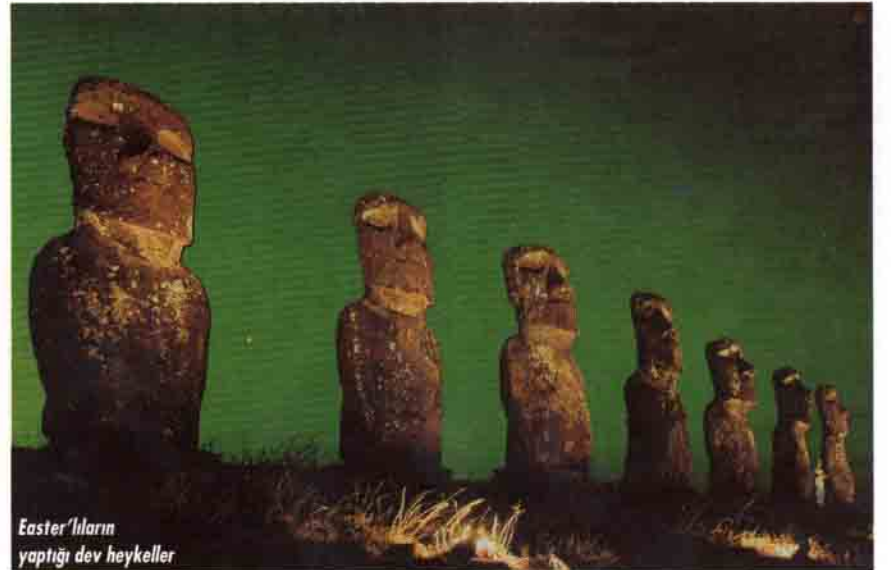
Easter'lıların yaptığı dev heykeller

denle en yakın adaya bile gidememişlerdi. Sadece üç veya dört kanoları vardı ve bunlarla Yunus avlıyorlardı. Easter adasının en önemli yapıları sayıları 1 000 kadar olan dev taş heykellerdi. Bunların boyları 10 ila 20 metre uzunluğunda, ağırlıkları ise 82-270 ton arasındaydı. Bu insanlar çok basit bazı taştan aletler ve ipler dışında hiçbir alet yapmamışlar ve sadece kas gücüyle çalışmışlardı. Kuşkusuz bu heykelleri yapmak iyi bir organizasyonla mümkündü. O halde neden bu insanlar heykel yapmak dışında başka hiçbir şey üretmemişlerdi? Neden sadece basit kanolar yapmış, hiçbir şey ekip dikmemişlerdi? Onları kalan son palmiye-i kesmeye ve yenisini dikmemeye iten sebep neydi? Yaptıkları heykeller o-