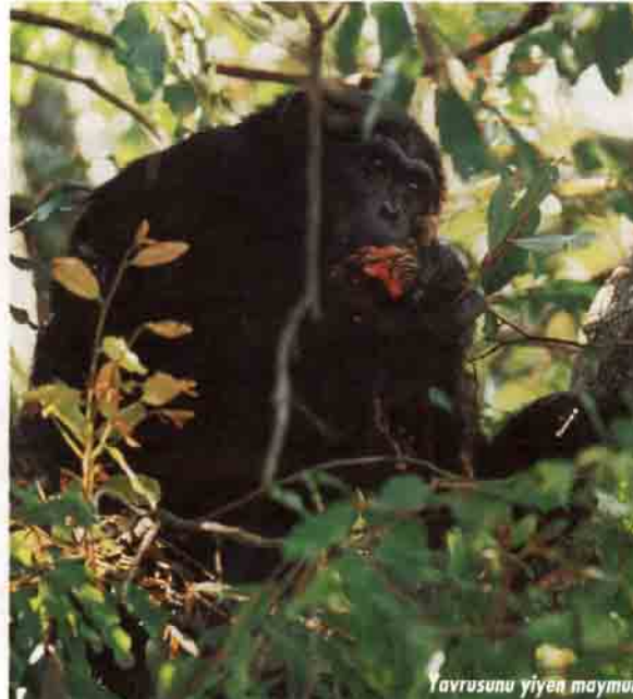
Yavrusunu yiyen maymun

hamile bırakamayacağını bilir ve bu nedenle dişi aslanın yavrusunu öldürüp yer. Böylece dişi aslanı tekrar hamile bırakabilir. Dişi hayvanların yavru öldürmesi çok nadirdir. Bu durum dikenli balık türünde görülür. Dişiyi çiftleşen erkek balık dişinin yumurtalarıyla doldurduğu yuvasında koruyucu görevi üstlenir. Ancak çiftleşmek isteyen diğer dişi balıklara ilgi göstermez. Bu erkek balıkla çiftleşmek isteyen bir dişi balık bunun yuvasına saldırır ve yumurtaları diğer bir dişi balığın yemesini sağlar.