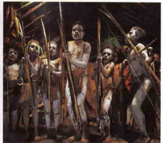
Günümüzde tek insan yiyenler olarak bilinen Yeni Gine yerlileri