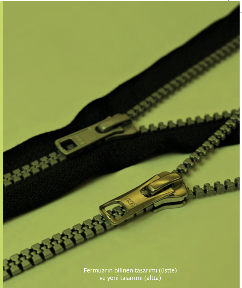
Fermuarın bilinen tasarımı (üstte) ve yeni tasarımı (altta)