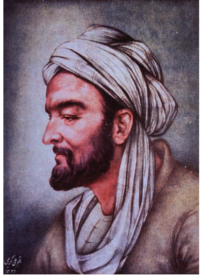
İbn Sînâ (980-1037)

bu nedenle hareket eden bir nesnenin ayrıldığı ve ulaştığı yerden söz edildiğini, dolayısıyla iki yer arasında belirli bir mesafenin olmasının gerektiğinin savunulduğunu açıklar. Devamında hareketin genellikle altı unsura bağlı olarak tanımlandığını, bunların “hareket eden”, “hareket ettiren”, “hareketin gerçekleştiği şey”, “hareketin başlangıç noktası”, “hareketin bitiş noktası” ve “zaman” olduğunu belirtir. Burada “hareketin gerçekleştiği şey” maddesine dikkat edilmelidir. Çünkü bu ifadeyle hareket eden nesnenin veya hareketin içinde gerçekleştiği ortamın özelliğinin, hareketin belirleyici unsuru olduğu belirtilir. Başka bir deyişle hareket edenin hareketinin nedeninin kendisi mi yoksa dış bir neden mi olduğuna dikkat çekilir. Bu yüzden İbn Sînâ açıklamalarını “Bir şey hem hareket ettiren hem de hareket