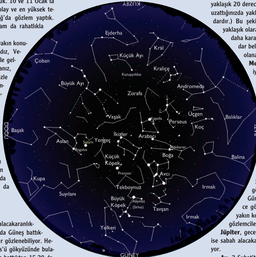
1 Şubat saat 22:00, 15 Şubat saat 21:00, 28 Şubat saat 20:00'de gökyüzünün genel görünümü.

Ay , 2 Şubat'ta dolunay, 10 Şubat'ta sondördün, 17 Şubat'ta yeniay, 24 Şubat'ta ilkdördün hallerinde olacak.