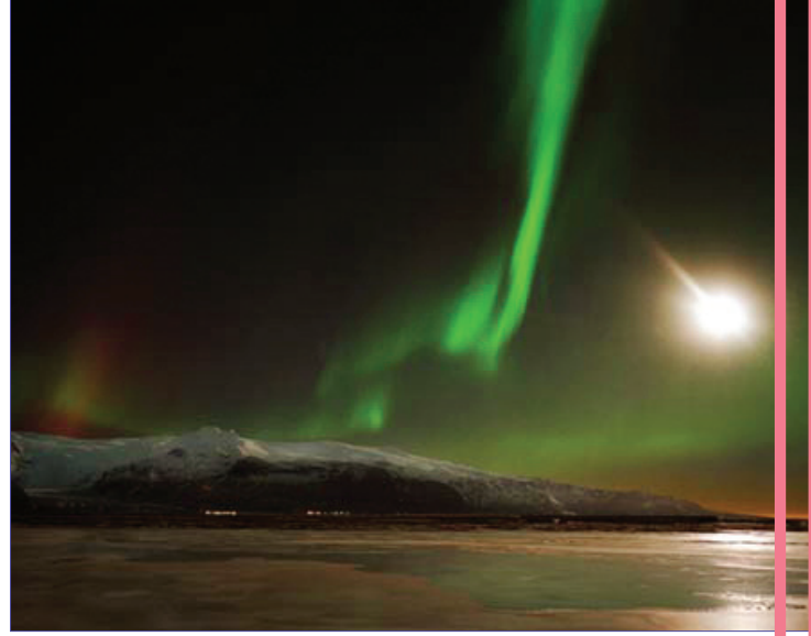
Kuzey Kutbu'na yakın bölgelerden görülebilen kuzey ışıkları, maddenin plazma haline güzel bir örnektir.

Bose-Einstein yoğunlaşması diğerlerine oranla çok yeni bir hal. En azından ben öğrenciyken henüz bi-