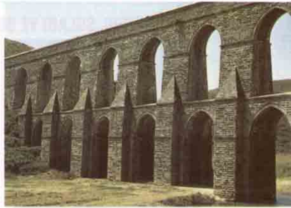
Kırkçeşme Tesisleri projesinde yer alan Güzelcekemer'in mansaptan görünüşü.

mahallede bir başka ev beğenmemiş. Başka bir yerden bulalım demişler. O çevreden ayrılmak da istememiş. Bu nedenle kendisine gene o mahallede istegine uygun yeni bir ev yaptırılarak verilmiş.