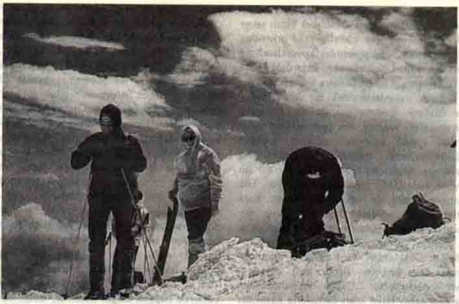
Kafile Suphan Dağı Zirvesinde