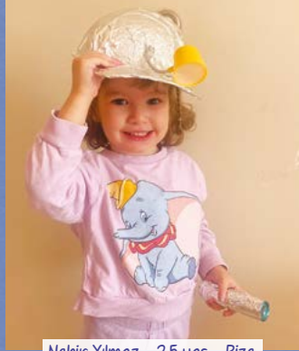
Nehir Yılmaz - 2,5 yaş - Rize