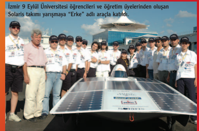
İzmir 9 Eylül Üniversitesi öğrencileri ve öğretim üyelerinden oluşan Solaris takımı yarışmaya "Erke" adlı araçla katıldı.