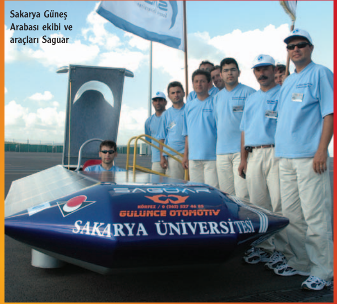
Sakarya Güneş Arabası ekibi ve araçları Saguar