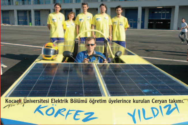
Kocaeli Üniversitesi Elektrik Bölümü öğretim üyelerince kurulan Ceryan takımı.