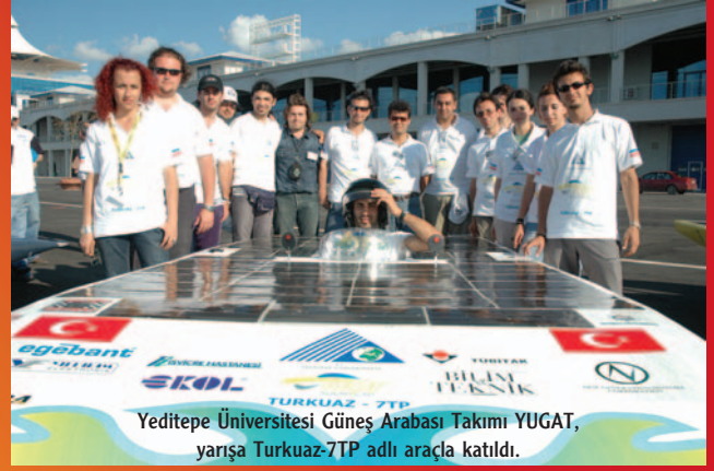
Yeditepe Üniversitesi Güneş Arabası Takımı YUGAT, yarışa Turkuaz-7TP adlı araçla katıldı.