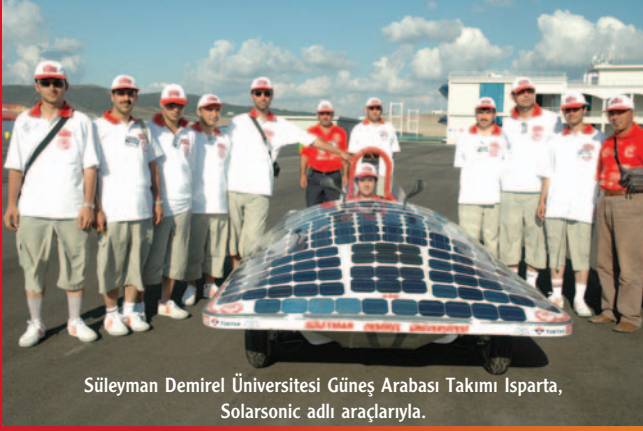
Süleyman Demirel Üniversitesi Güneş Arabası Takımı Isparta, Solarsonic adlı araçlarıyla.