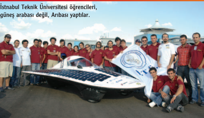
İstanbul Teknik Üniversitesi öğrencileri, güneş arabası değil, Arıbası yaptılar.