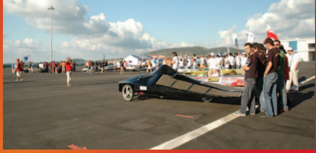
Sakarya Güneş Arabası ekibi ve araçları Saguar