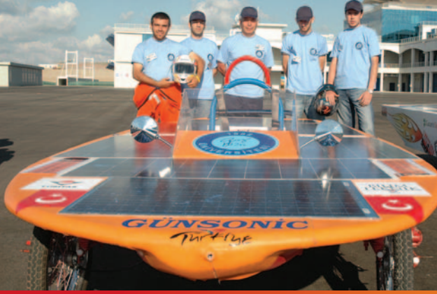
Gazi üniversitesi ekibi, Formula G'ye, değişik tasarımlı bir araçla geldi.