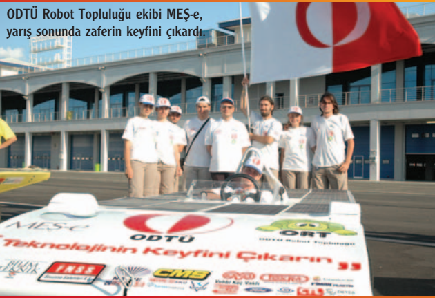
ODTÜ Robot Topluluğu ekibi MEŞ-e, yarış sonunda zaferin keyfini çıkardı.