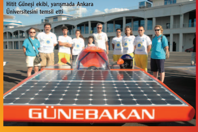
Hitit Güneşi ekibi, yarışmada Ankara Üniversitesini temsil etti