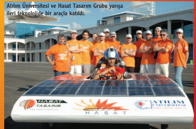
Atılım Üniversitesi ve Hasat Tasarım Grubu yarışa ileri teknoloji de bir araçla katıldı.