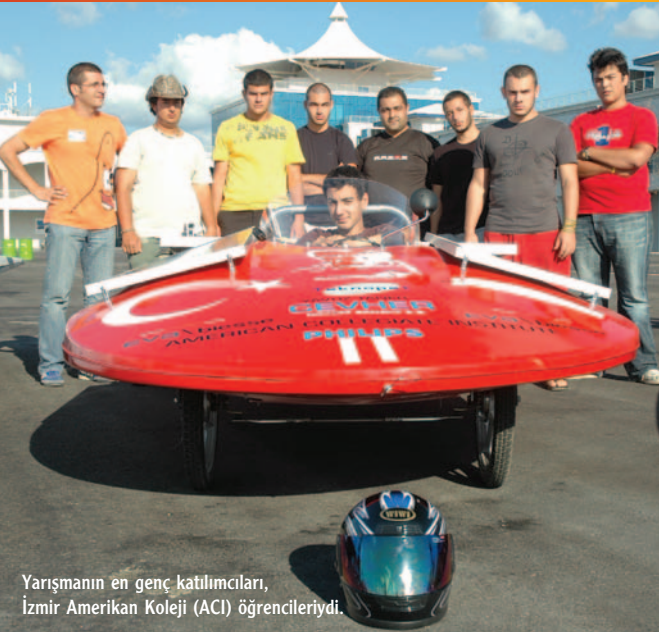
Yarışmanın en genç katılımcıları, İzmir Amerikan Koleji (ACI) öğrencileriydi.