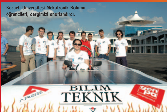
Kocaeli Üniversitesi Mekatronik Bölümü öğrencileri, dergimizi onurlandırdı.