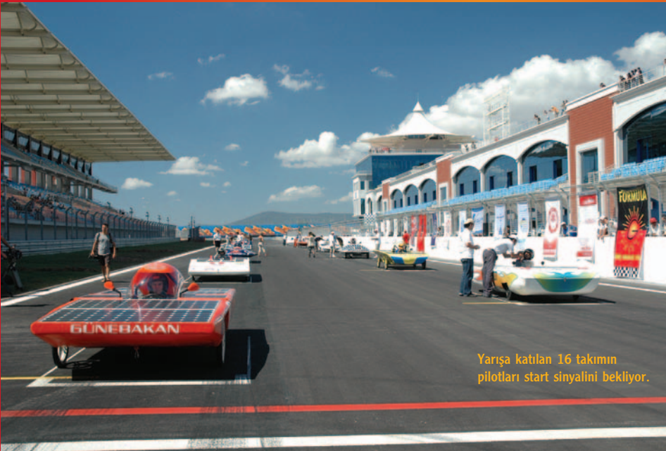
Yarışa katılan 16 takımın pilotları start sinyalini bekliyor.