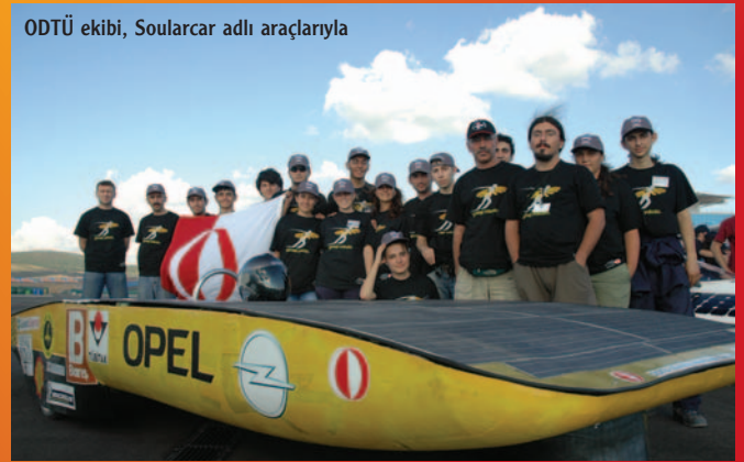
ODTÜ ekibi, Soularcar adlı araçlarıyla