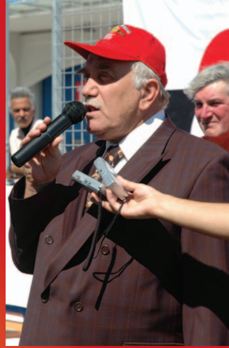
Sanayi ve Ticaret Bakanı Ali Coşkun Formula G'nin açılış konuşmasını yaparken.