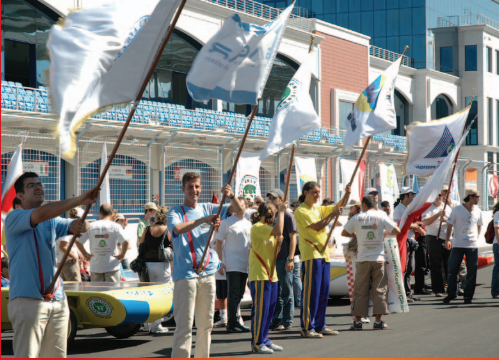
Takımlar yarış öncesi araçlarını seyircilere tanıttılar