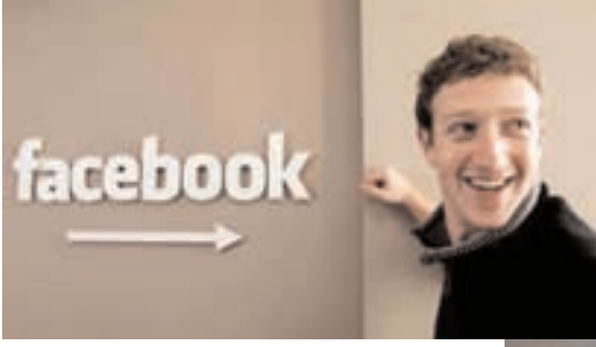
Facebook'un kurucusu Mark Zuckerberg.

sa Kaliforniya'nın Palo Alto eyaletine taşınan ekip Facebook'u geliştirmek için Adam D'Angelo ve Sean Parker'dan yardım almaya başlıyorlar. Aynı yılın eylül ayında PayPal adlı çevrimiçi aracı para transferi sitesi kurucusu Peter Thiel'den 500.000 dolar mali destek alıyorlar. Ağustos ayına gelindiğindeyse ilk alan adları olan "thefacebook.com"u sadeleştirmek için daha önce bir şirketin satın aldığı şimdiki alan adları olan "facebook.com"u 200.000 dolara satın alıyorlar. Bu projeye gerçekten inanmış olmalı ki, 8-10 dolara alabilecekleri alan adı için bu denli bir para yatırmayı göze alabilişler.