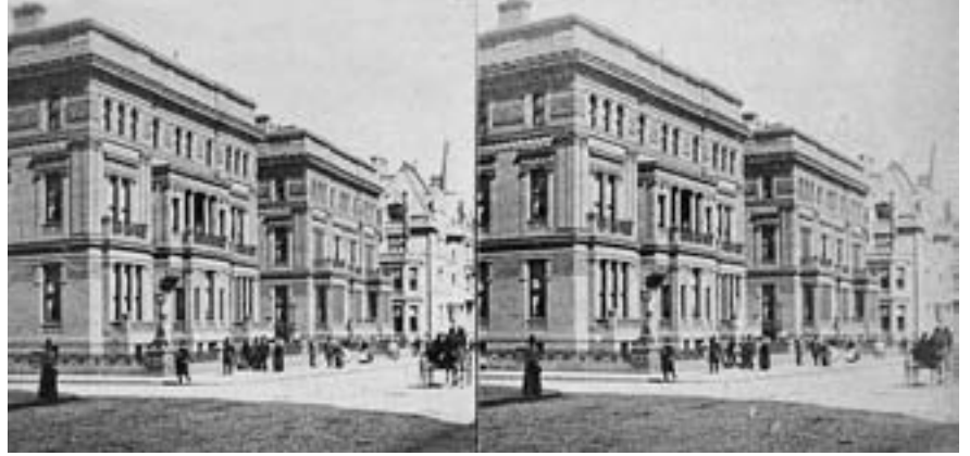
Gözlerimiz arasındaki mesafe dolayısıyla sağ ve sol gözümüze düşen görüntü birbirinden küçük farklılıklar gösteriyor.

Đeja vu’yle ilişkili ilk kuram sol ve sağ gözden beyne giden sinirsel iletimdeki milisaniyelik farklılara gönderme yapıyor. Dış dünyadan yansıyan ışık (görüntü) kornea ve lensten geçip retinaya düşüyor. Her iki gözümüz arasındaki mesafeyi düşüncecek olursak, sağ gözümüz