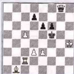
Beyaz oynar kazanır

Çözümler (1) 1. ... Ka2 2. KB1 Ag3+!-!-! 3. Vxg3 Kxh3! kazanır ve 3 hxg3 Ka8 mata zorlar (1) 1. Kf2+ Se5 2. Kf5+! İki bir tehdit çünkü 2. ... Sx5 3. d4 ya da 2. ... exd5 3. d4+ Şe6 4. Fa2+ d5 5. cxd6+