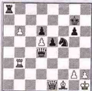
Siyah oynar kazanır