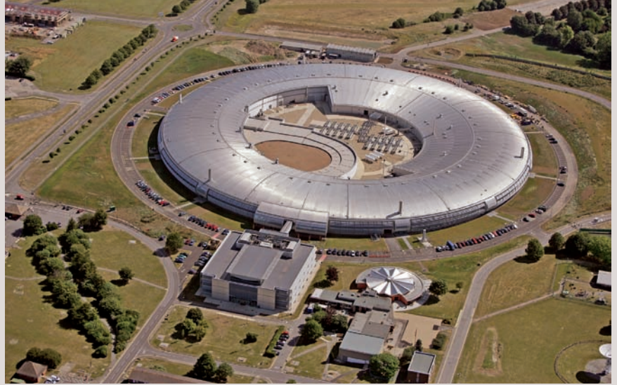
Diamond'un kuşbakışı görüntüsü. Halka biçimindeki bina, elektronların en fazla hızlandırıldığı kesim. Elektronlar burada eriştikleri hızla Dünya'nın çevresini saniyede 7,5 kez dolaşabilirler.

Yedi deney istasyonu ile yaşamı başlayan Diamond'da her yıl üç yeni istasyon eklenmesi planlanıyor. İlk yedi istasyon, maddelerin yüksek sıcaklıklarda ve yüksek basınçta davranışlarını araştırmada,