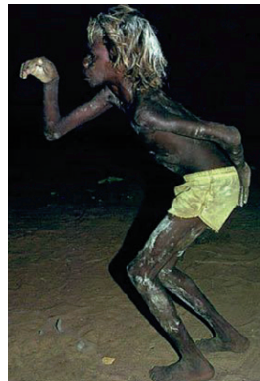
Aborijinlerin yaşamında dans ve müzik vazgeçilmez ikidir. Onlar sevinçlerini, hüznlerini, beklentilerini, doğayla ilişkilerini bile dans ve müzikle anlatırlar.