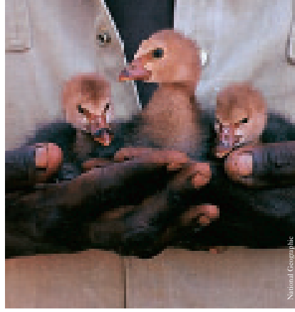
Avustralya yerlilerinden Pintubilerde "kanyininpa" kavramı bir hak ve sorumluluk olarak, sahip olma, elde tutma ya da gözette tutma anlamına gelir.

Koydukları kurallara uyulmasında kişiler gibi gruplar da sorumludur. Kişiler birbirine karşı saygılıdır. Kişiler arasında kurallara uyulmaması durumunda kişi kadar grup da suçlu sayılır. Grup ya da gruplar arası kişilerin katılımıyla, suça karşılık düşen cezanın tespit edildiği toplantı gelenekleri vardır. Yüzyıllardır yaşamlarında kabileler arası kanlı savaşlar olmamıştır. Avcılar arasında çıkan çatışmalarsa, yapılan toplantılarla çözülür. Komşu kabileler-