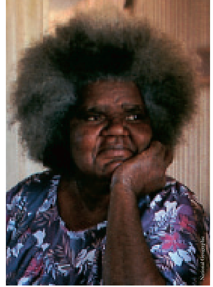
Beyazların Avustralya'yı işgal etmesiyle Aborijinlerin yaşamı değişir. Hep olduğu gibi, değişiklikten en çok etkilenen çocuklar olur. Yalnızca 20. yüzyılın başında 100 000 çocuk ailelerinden zorla alınıp, misyonerlerin okulunda beyazlara uşak ve hizmetçi olarak yetiştirilir.

cak teşekkür edilirdi. Beden ondan yapılmıştı. O yiyecek ve besin verir, ilaç sağlar, gözyaşlarıyla temizlerdi. Onun kollarında uykuya dalınırdı. İnsan öldüğünde, kullanılmış olan kemikleri atalarının bedeniyle ve henüz doğmamış olanlarla birbirine toprakta karıştır; daha doğru ifadeyle toprak bu karışımı sağlamak için onları kabullendirirdi. Ölüm, topraktan alınan ve artık işe yaramayan bir şeyi ona geri verme zamanıydı. Ölüm bir son değildi. Ölüm, sonsuzluk dünyasında değişik bir biçimde var olmaktı.