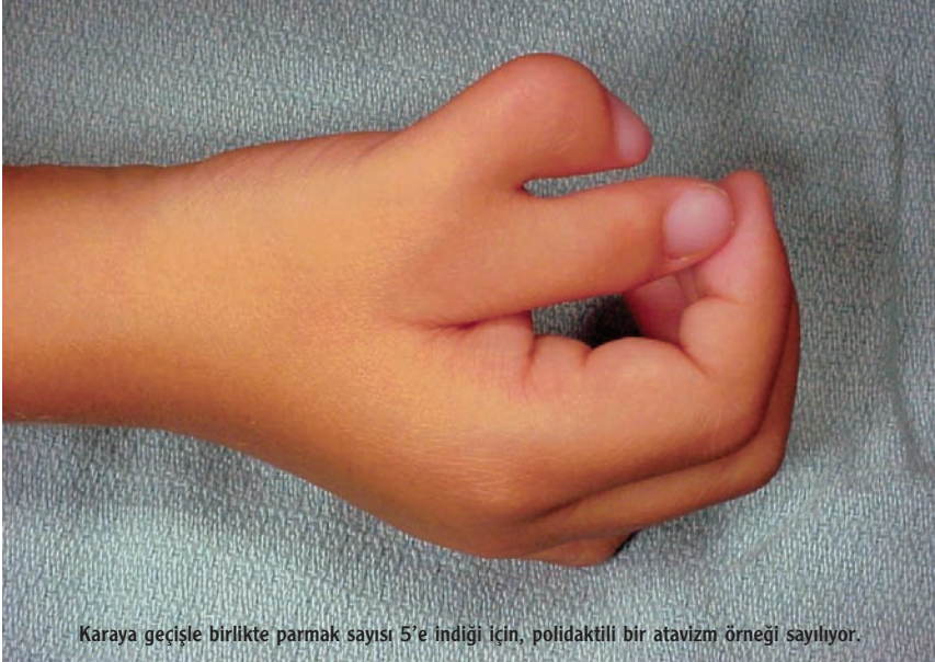
Karaya geçişle birlikte parmak sayısı 5'e indiği için, polidaktili bir atavizm örneği sayılıyor.

El ya da ayaklarda 5'ten fazla parmağa sahip olma (polidaktili), parmakların birbirine kısmen de olsa yapışık bulunması (sindaktili), perde parmaklılık ve bazı bireylerde rastlanan çok iri köpek dişleri de sıklıkla birer atavizm örneği kabul ediliyorlar.