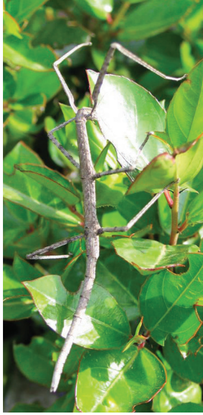
Akdeniz bölgemizde yayılış gösteren kanatsız bir çalı çekirgesi: Bacillus rossius