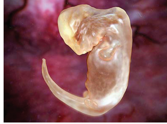
Yunus embriyosunda, gelişimin ilerleyen evrelerinde körelecek olan arka bacak çıkıntıları

Kuyruksuz ve kuyruklu kurbağaları (ya da alışıktığımız adlarıyla semenderleri) içeren ikiyaşamlılar (Amphibia) sınıfının adı, karasal yaşasalar bile yaşamlarının belirli bir evresinde suya bağımlı olmalarından geliyor. Bazı tropik kurbağa türleri haricinde, ikiyaşamlılarda üreme hücreleri suya bırakılıyor, yumurtalar suda dölleniyor ve suda gelişiyor. Kısa bir süre sonra, yumurtalardan sucul yaşayan larvalar çıkıyor ve belirli bir evrede de bu larvalar başkalaşım geçirerek, kara yaşamına uyum sağlamış erginlere dönüşüyorlar. Meksika ve Kuzey Amerika bölgelerinde yayılış gösteren semenderler de bu şekilde başkalaşım gösteren ikiyaşamlılar arasında. Ancak, aralarında birkaç tane istisna tür var. Bunlardan en meşhur olanıysa, hiç kuşkusuz axolotl ( Ambystoma mexicanum ). Metamorfoz geçirmeyerek yaşamı boyunca larva formunda kalan bu sevimli canlı, çok uzun zamandır bilim dünyasının ilgisini çekiyor. Araştırmacılar, önceleri bu canlının tek başına metamorfoz özelliğini yitirmiş olduğunu düşünüyorlardı. Ancak, semenderler üzerinde yapılan çalışmaların sayısı arttıkça, gerçeğin biraz daha farklı olduğu anlaşıldı. Sanılanın aksine, semenderlerin aile ağacı, bu grubun zaten metamorfoz yeteneğini kaybetmiş olan bir atadan geldiğini işaret ediyor. Yani, aslında aykırı olan durum, metamorfozun kaybedilmesi değil, yeniden ortaya çıkmış olması. Ayrıntılı incelemeler, gerçekten de metamorfozun 10 milyon yıl boyunca bu grupta sürekli olarak kay-