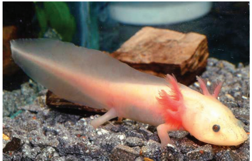
Neotenik bir canlı olan Ambystoma mexicanum

Semender örneği, Raff'ın 10 milyon yıl modeline uyuyor. Ancak, daha yakın tarihli bazı çalışmalar, bu zaman sı-