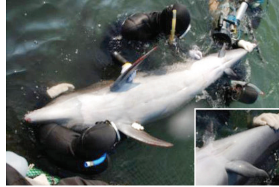
Japonya'da balıkçıların yakaladığı şişeburunlu yunus ve yunusun normal dışı pelvik yüzgeçleri

bolup yeniden ortaya çıktığını gösteriyor. Hatta, bilim insanlarına göre, bazı gruplarda metamorfozun kaybedilmesinin tek nedeni, kendilerinden köken alan gruplarda metamorfozun yeniden kazanılmasını sağlamak.