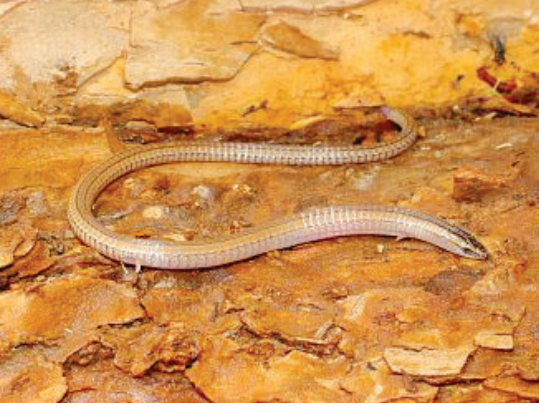
Güney Amerika kökenli bir kertenkele: Bachia

nırının dışında kalan örnekler açığa çıkmadı. Görünen o ki, öykünün tek kahramanı sessiz genler değil.