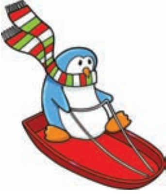
Hazırlayan: Hande Kaynak İllüstrasyon: Thinkstock

Bilim Çocuk dergisinin 146. sayısının ektidir.