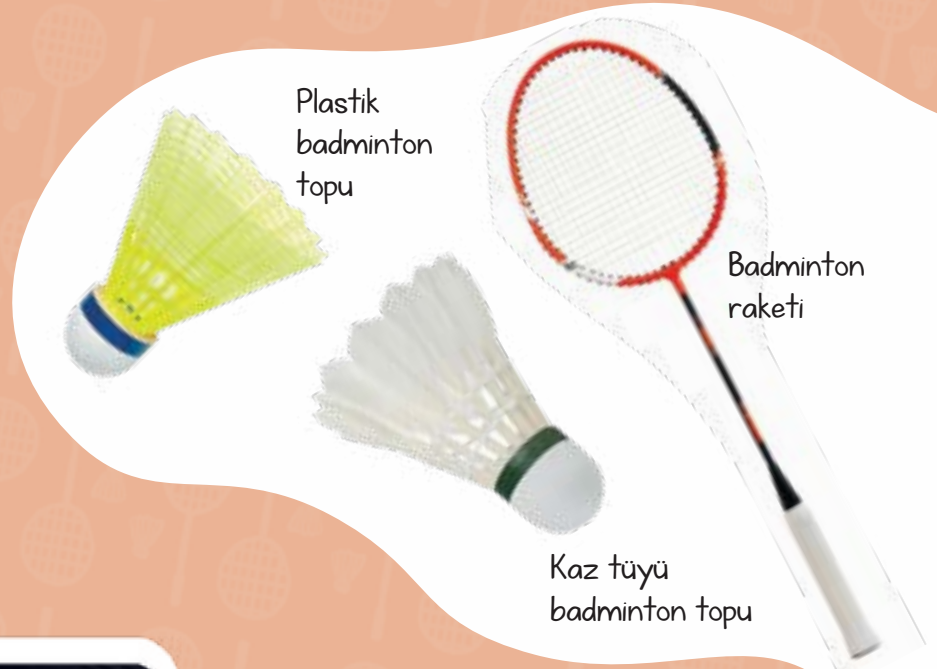
Plastik badminton topu

Badminton, dünyanın en hızlı raket sporlarının başında gelir. Bir badminton topunun hızı saatte 330 kilometreye kadar ulaşabilir. Tüytop da denen badminton topu yaklaşık bir koni biçimindedir. Topun alt kısmında ince deriyle kaplanmış, yuvarlak bir mantar parçası yer alır. Üst kısmıysa kimi zaman plastik bir parçadan kimi zamansa 16 kaz tüyünden oluşur. Çok hafif olan badminton topu, rüzgârdan çok kolay etkilenir.