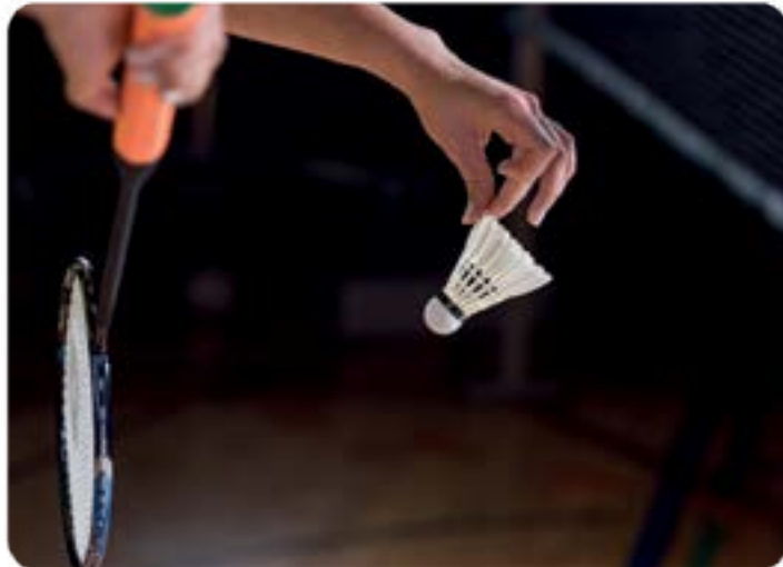
Kaz tüyü badminton topu

Sporcular topun alttaki mantar kısmına rakete vururlar. Top rüzgârda süzülürken mantar kısmı öne geçer ve tüylü kısım geride kalır. Oyun sırasında topun başka yönler e savrulmaması için tüyleri nemlendirilir. Çabuk kırılabilen badminton toplarının oyun sırasında birkaç defa değiştirilmesi gerekebilir. Badminton raketiys e genellikle alüminyum ve karbon fiber gibi çok hafif malzemelerden yapılır. Bu raket çok hafiftir. Telleri genellikle plastikten yapılır.