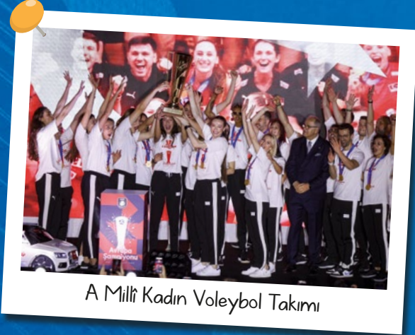
A Millî Kadın Voleybol Takımı