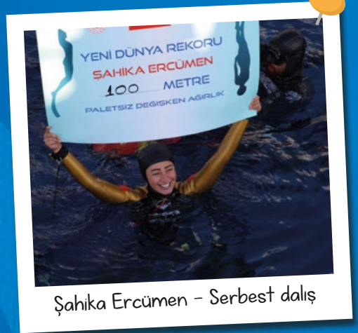
Şahika Ercümen - Serbest dalış