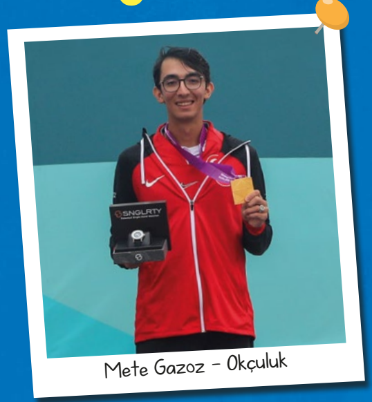
Mete Gazoz - Okçuluk

Bu yıl Cumhuriyetimizin 100. yılını kutlamanın sevincini ve gururunu yaşıyoruz. Birçok millî sporcumuz da bu gururu pekiştiren başarılar elde etti. Dünya ve Avrupa şampiyonlukları kazanıldı, Türkiye ve dünya rekorları kırıldı, onlarca madalya elde edildi... Başarıların elde edildiği alanlardan bazılarıysa yüzme, serbest dalış, voleybol, güreş, okçuluk, para masa tenisi, tekvando, para tekvando, boks ve atletizm. Bu sporcularımızın birçoğu aynı zamanda 2024 Paris Olimpiyat ve Paralimpik Oyunları'na kota aldı, yani gelecek yıl olimpiyat madalyası için mücadele edecekler.