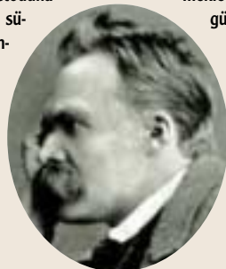
Varoluşçu felsefenin temsilcilerinden Friedrich Nietzsche

Pragmatist yaklaşım açısından eğitim anlayışının çağın gereklerine göre şekil alabilen, oldukça esnek bir yapısının mevcut olduğu görülmektedir. Ancak bu esnekliğin özünü ihmal eden bir şekilde düşünülmemelidir. Aktarılmak istenen okulun, öğrenciyi hayata hazırlamaya yönelik tam etkinliğinin, ancak hayattan kopuk olmamasıyla başarılabileceğidir.