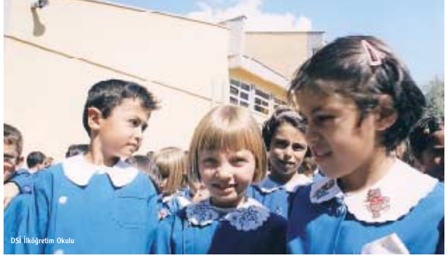
DSİ İlköğretim Okulu

Bu nedenle toplumun, çağın ve ülkenin gereklerine bütüncül bir yaklaşımla ele alınacak öğrenci kavramı geçmiş, bugün ve gelecek zaman boyutuyla değerlendirilerek felsefi açıdan, işlevsel bir zemine oturtulmalıdır. Çünkü bu zemin, içinde bulunduğumuz çağda hedeflerin ve davranışlarının somutlaştırılması bakımından, bir gereklilik değil zorunluluk halini almıştır.