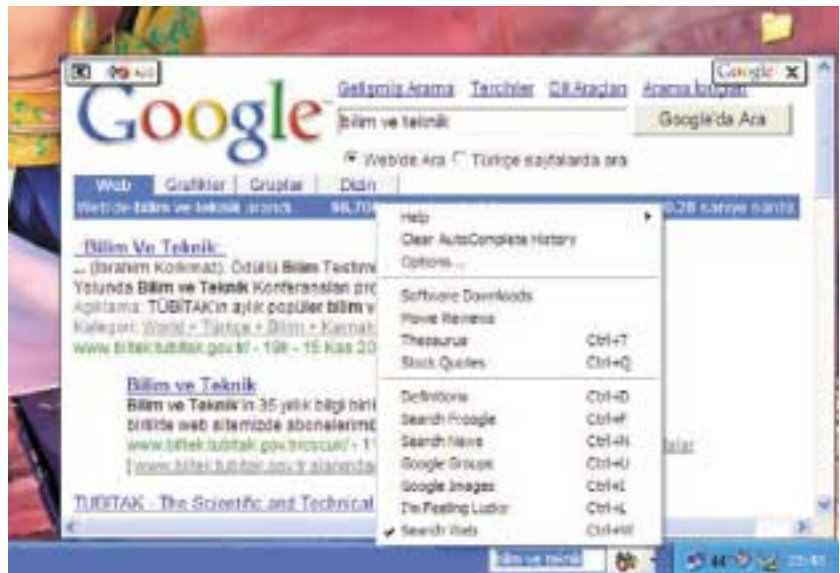
Google Deskbar sayesinde Google üzerinde arama yapmak ve sonuçları incelemek için İnternet tarayıcınızı bile çalıştırmaz gerekir

Büyük ihtimalle çoğunuz İnternet üzerinde herhangi bir konuda arama yapmak için http://www.google.com adresinden erişilebilen Google arama motorunu biliyor ve kullanıyorsunuzdur. Hatta Google'ın arama özelliklerini İnternet tarayıcınıza da yerleştiren ve http://toolbar.google.com adresinden indirilebilen Google Toolbar uygulamasını bilip kullananlarınız da vardır. Tüm bunların üstüne Google, geçtiğimiz ay Google Deskbar adını verilen yeni bir uygulamayla harika bir işe daha imza attı. Google Deskbar'ın yaptığı şey, özetle Google'ın gelişmiş arama özelliklerini Windows araç çubuğu üzerine entegre ederek aramalarınızı araç çubuğuna yazacağınız kelimelerle doğrudan gönderebilmenizi ve sonuçları anında inceleyebilmenizi sağlamak. Üstelik bu yolla Google'ın resim ve haber arama gibi tüm özelliklerine kolayca erişebileceğiniz gibi, arama sonuçlarını incelemek için İnternet tarayıcınızı çalıştırmak zorunda bile kalmıyorsunuz. Google Deskbar uygulamasını indirmek ve bilgisayarınıza kurmak için http://toolbar.google.com/deskbar/index.html adresini kullanabilirsiniz.