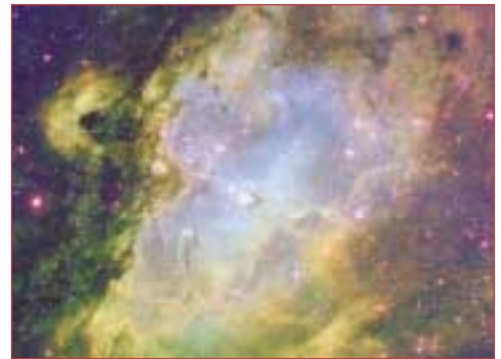
Eagle (Kartal) nebulasının görünümü.

Değişik uzay resimleriyle dolu sitede, fotoğraflar hakkında ayrıntılı bilgiler ve açıklamalar da yer alıyor. Ayrıca, resimler açıldığında, resmin üzerine tıklayarak daha büyük bir halini bilgisayarınıza indirebiliyorsunuz. Ancak, ne yazık ki açıklamalar İngilizce olduğu için, bu konuda İngilizce bilen birinin yardımı gerekebilir.