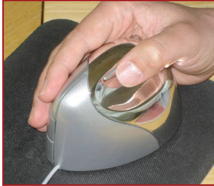
Alışıldık tasarımların dışına çıkan bu fare, bileği rahat ettirmeyi hedefliyor.

Bilgisayarda kullanılan farelerin bu güne dek birçok farklı biçimini gördük. Bu yeni fareyse, farklı tasarımının, bilgisayar kullanıcılarının sağlığı açısından daha iyi olduğu iddiasında. Normalde fareyi kavramak için avucunuzu aşağı çevirir ve farenin üzerine yerleştirirsiniz. Bu fareyi kullanırken avucunuzu aşağı çevirmenize gerek yok, sanki el sıkışır gibi elinizi yan tutup fareyi kavramanız yeterli. Böylece elin daha rahat ve doğal bir konum alması sağlanarak uzun süreli bilgisayar kullanımının neden olduğu rahatsızlıkların ortaya çıkması önlenir. Gelgelelim bu kolaylık, normal bir fareye ödediğinizden biraz daha pahalıya mal oluyor. Evoluent VerticalMouse 2 adlı bu ürün hakkında daha ayrıntılı bilgi ve resimler için http://www.evoluent.com/vmouse2.html adresini ziyaret edebilirsiniz.