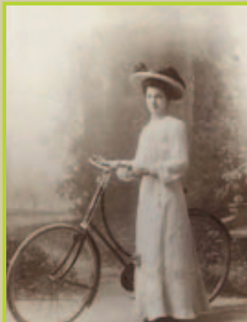
Bisikletin atalarından biri

olarak bildiği velosipetler 1870'lerde geliştirildi. 1890'larda eklenen yeniliklerden sonra bisiklet artık güvenli ve sürüşü rahat bir ulaşım aracı haline