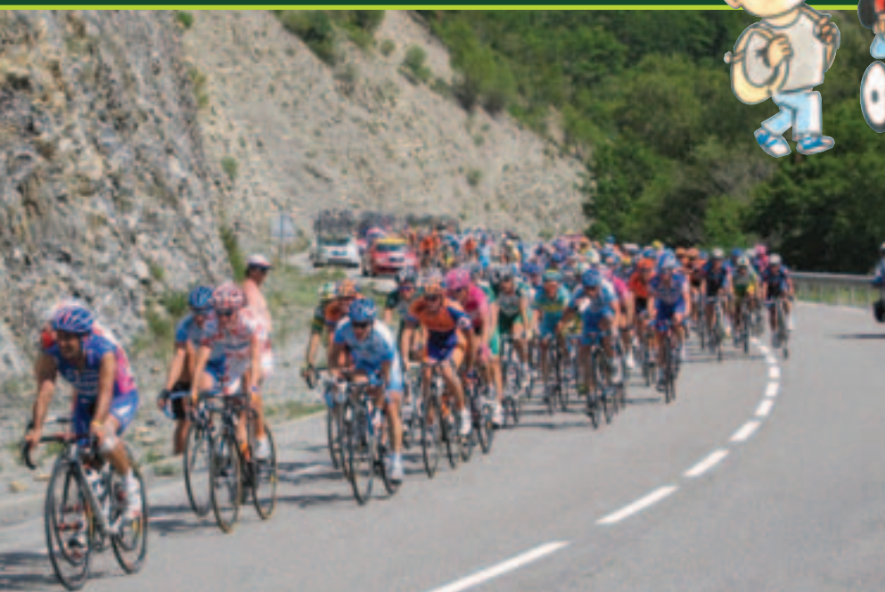
Dünyanın en ünlü yarışı, Fransa'da düzenlenen Fransa Bisiklet Turu.